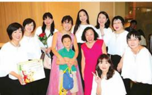
演奏後緊張が解けて笑顔！