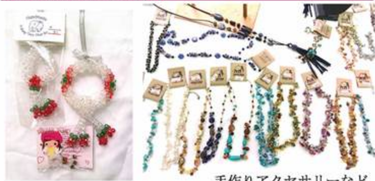
手作りアクセサリーなど