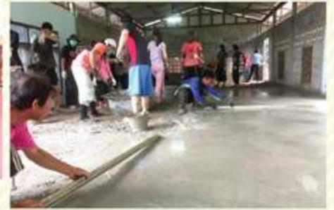
シーカー・アジア財団