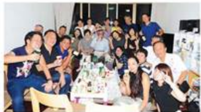
打ち上げ、おつかれさまー！