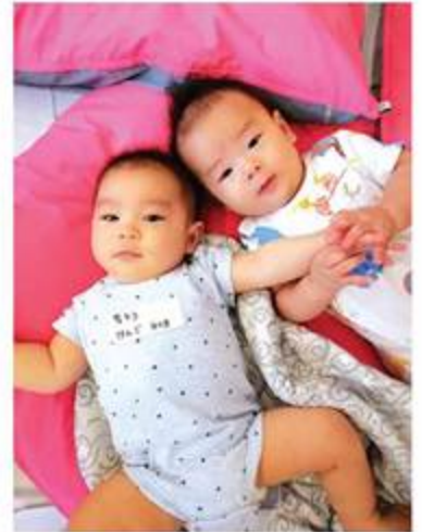
「僕たち、お友達になったよ！」