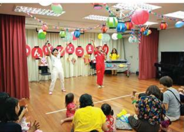
ステージでは「ウソ！ホント？クイズ」に、サメ家族のダンスで大盛り上がり！