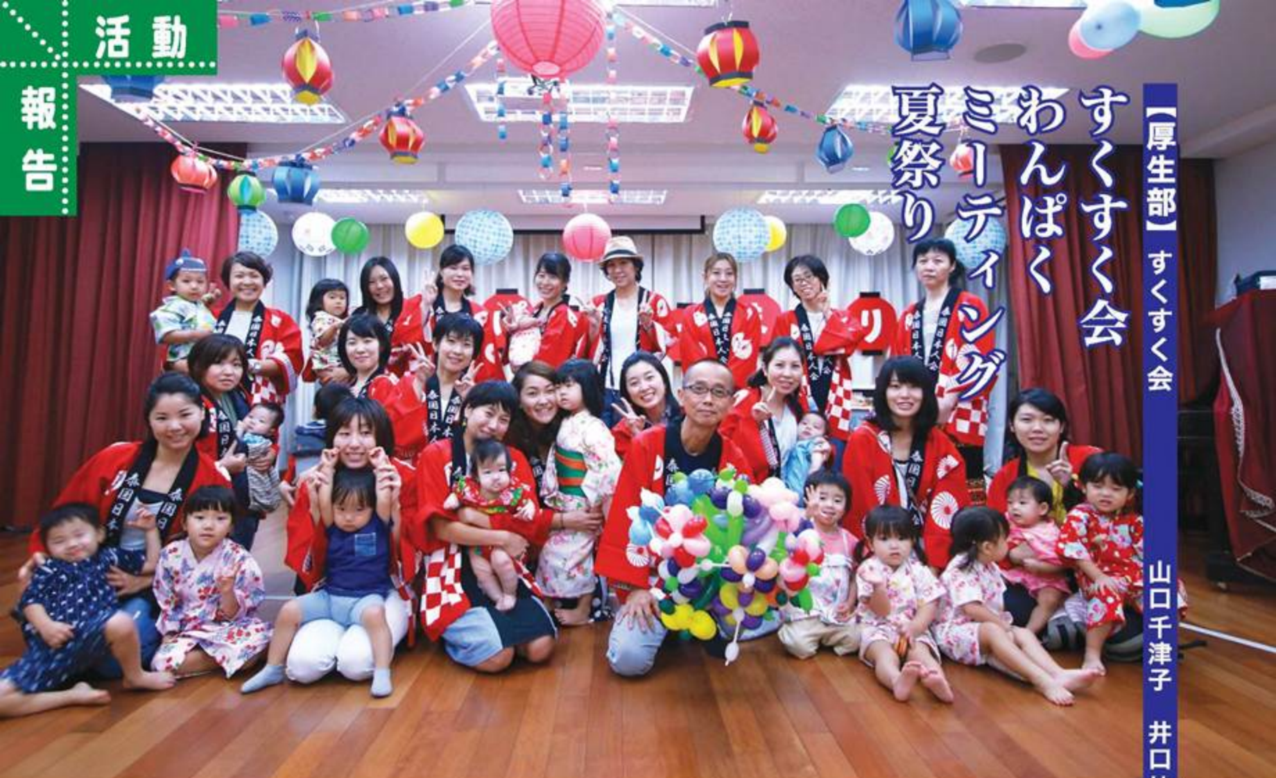
スタッフ集合：お揃いの法被を着て夏祭りを盛り上げました