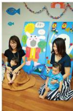
ママと甚平の赤ちゃんでパチリ。夏の思い出になりますね