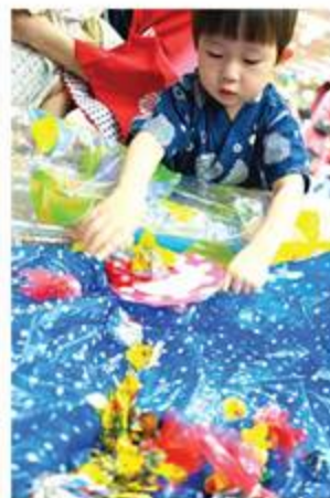
金魚すくえた～！あれ？アヒルさんもいるね

浴衣や甚平を着た子どもとママたち約50組が参加。日本の夏の雰囲気味わってもらいました。