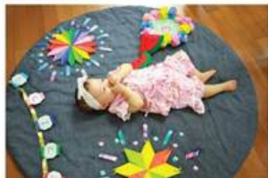
ねんねの子向けに花火の寝相アートも準備しました

8月3日(金)、日本人会別館にて未就園児を対象にしたすくすく会の夏祭りが開催されました。 遊びに来てくれたのは、浴衣や甚平を着た子どもとママたち約50組。 写真コーナーにバルーンアートのプレゼント、的あて、金魚のつかみ取りといったゲーム、風鈴作りといったブースは赤ちゃんから楽しめる工夫もたくさん。最後はステージで歌と踊りに大盛り上がり。