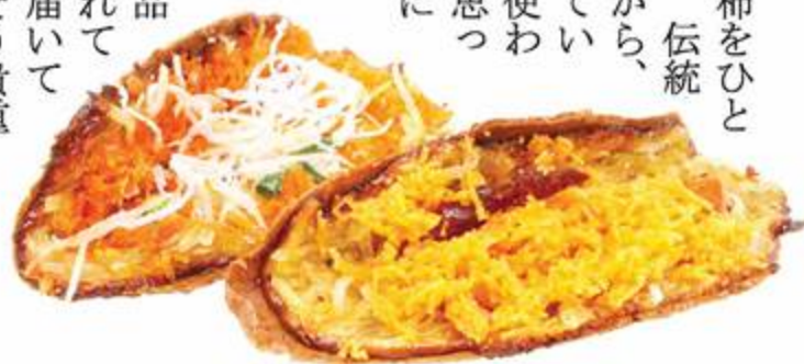
鶏卵素麺入りがかノム・ブアンタイ・ワーン(甘い)、甘辛ココナッツ入りがかノム・ブアンタイ・ケム(塩味)