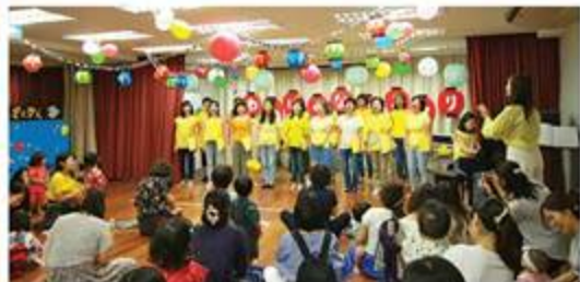
女声コーラスの皆さんの歌声に会場全体が聴き惚れました