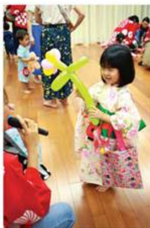
歌謡コーラスの方がボランティアでたくさんの風船をプレゼントしてくれました