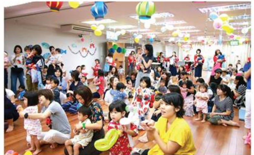
「わんぱくミーティング夏祭り」8月3日(金)、日本人会別館にて未就園児を対象にしたすくすく会の夏祭りが開催されました。本誌、活動報告で紹介しています (p13)