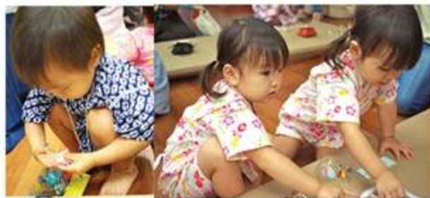
風鈴にシールをぺったん、上手にできたでしょ？

浴衣や甚平を着た子どもとママたち約50組が参加。日本の夏の雰囲気味わってもらいました。