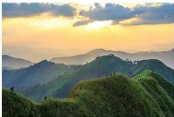
表紙：カオ・チャンプアック 場所：カンチャナブリー県 トーンパーブーム国立公園