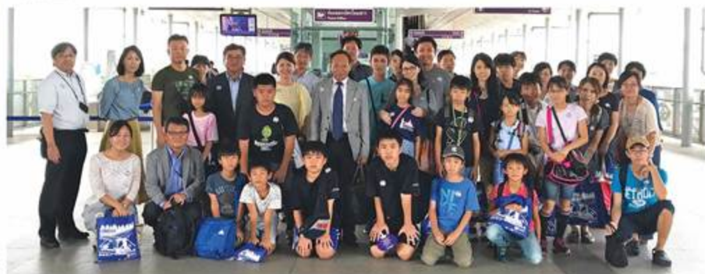
クロンバンパイ駅ホームにて参加者集合写真

8月6日(月)にJICAのご協力によりパイプライン視察会を開催し、車両基地（車庫・整備場）& 中央管理室視察、乗車体験を行いました。40名が参加し、普段立ち入ることができない場所を特別に見学させていただき、日本がタイの発展にどのように貢献できているかを知ることができた貴重な体験となりました。