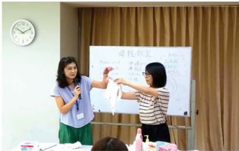
7月18日(水)の出産準備母親教室