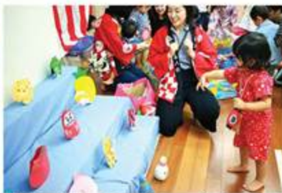
的もボールも手作りの的あて。だるまさんをねらって…

8月3日(金)、日本人会別館にて未就園児を対象にしたすくすく会の夏祭りが開催されました。 遊びに来てくれたのは、浴衣や甚平を着た子どもとママたち約50組。 写真コーナーにバルーンアートのプレゼント、的あて、金魚のつかみ取りといったゲーム、風鈴作りといったブースは赤ちゃんから楽しめる工夫もたくさん。最後はステージで歌と踊りに大盛り上がり。