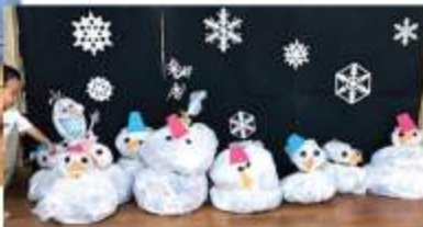
たくさんの雪だるまができました