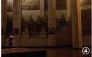
①黄昏時のワット・ブッタニミット仏塔 ②2000年前に作られたと言われる プラ・ブッタサイヤート涅槃仏 ③3体の大きな仏 像の一つ ④ワット・ブッタニミット仏 塔内。人がとても小さく見える