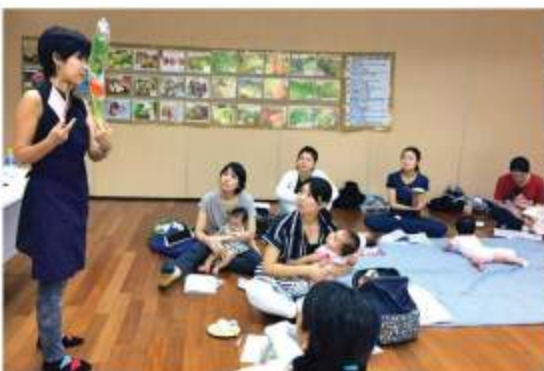
広東菜は栄養豊富、小松菜と同じように使えて便利です