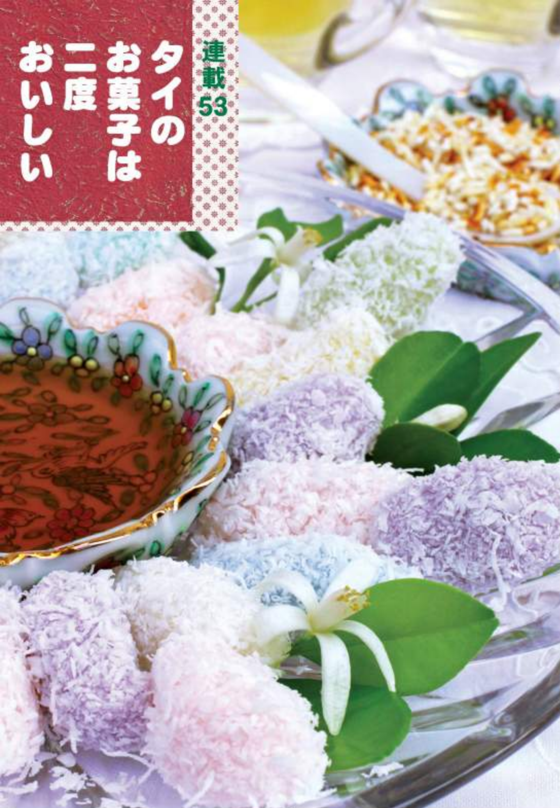
菓子店で求めたカノム・ニィアオขนมเหนียว。付属の揚げたお米のあられも美味ですが、今回は昔ながらの煎り米を添えて