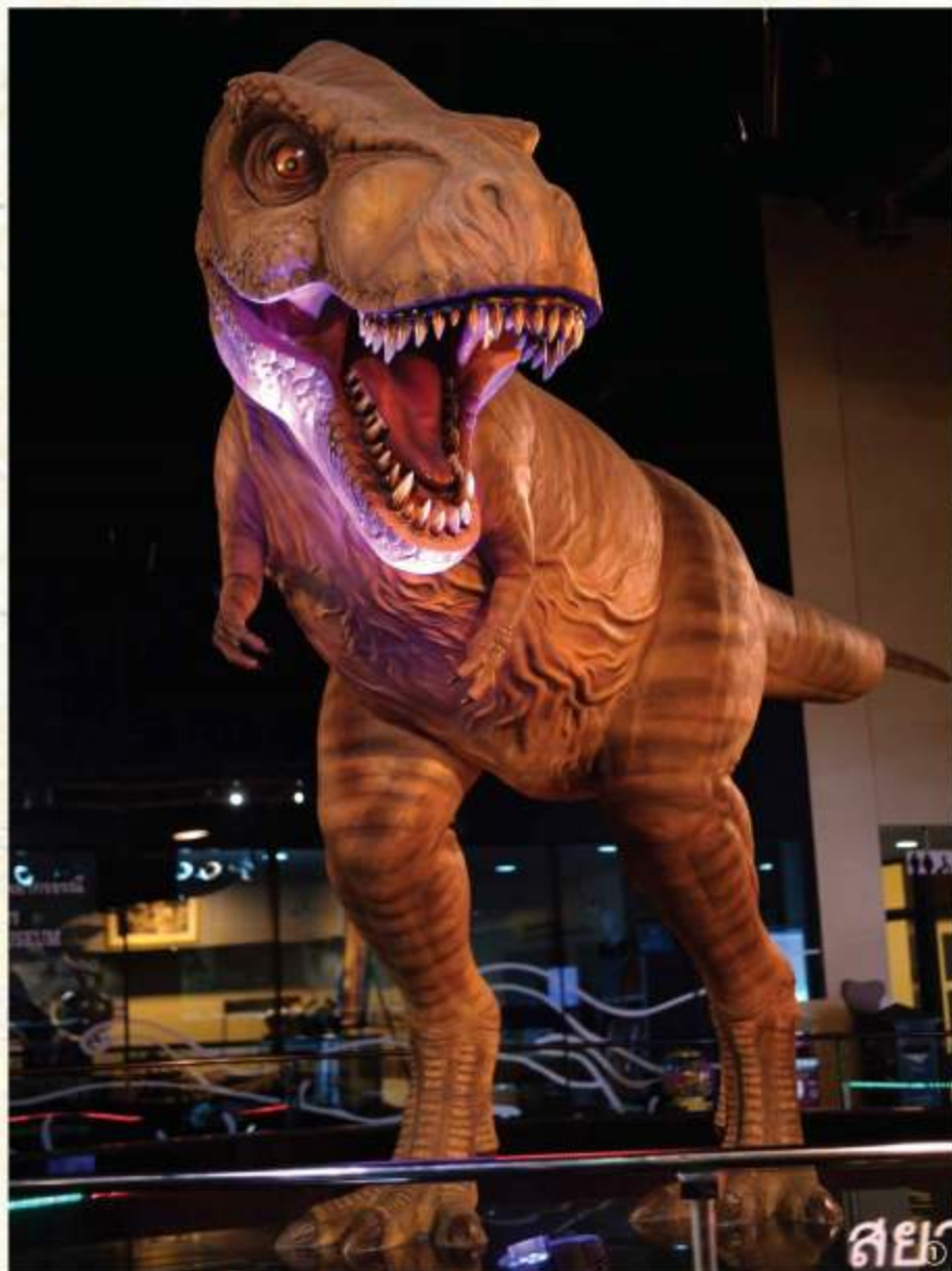
①「シャムの暴君」と呼ばれるシャモティラヌス ②ほぼ完全な恐竜の個体の化石発掘現場も間近に見ることができる ③大迫力の骨格標本も多数 ④博物館の建物の前にもお馴染みの草食恐竜が

首都バンコクから北東に519キロ、車で約7時間。バンコクから直通の長距離バスも運行中。コンケンなど近県まで飛行機で行く方法も。ただし、現地での移動は公共交通機関は限られているので、ホテルなどで運転手付きワゴン車を手配する方法が便利でしょう。