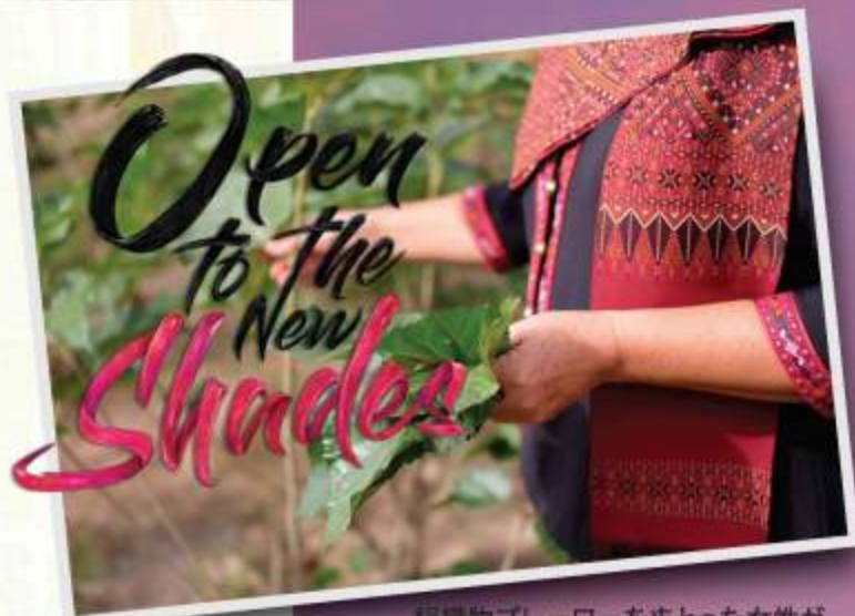
絹織物プレーワーをまとった女性が手にしているのは登の餌になる桑の葉

http://www.dmr.go.th/main.php?filename=MST2015__EN