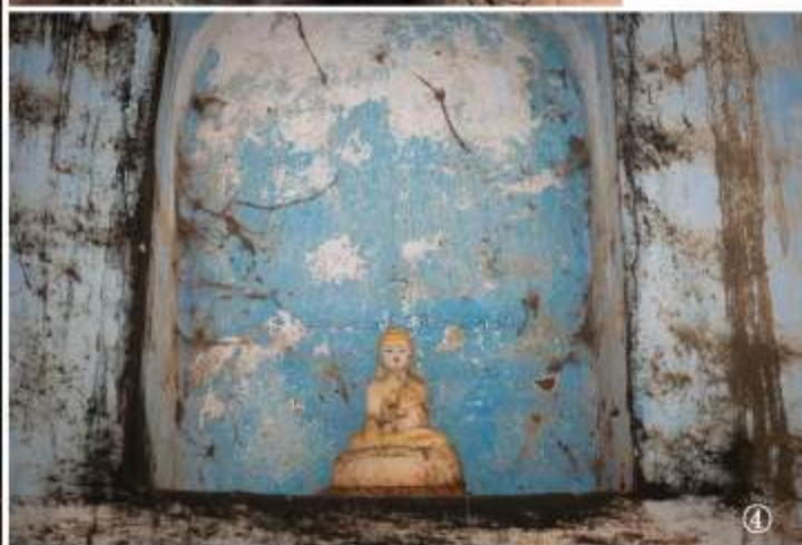
①②サダン洞窟 ③④クガン洞窟 ⑤奇岩チャウカラッ・パゴダ

まずはこの旅のメインイベント“サダン洞窟寺院”へと向かいます。パアンには数百以上もの洞窟寺院があるそうですが、観光用に整備されているのはほんの僅か。その中でもサダン洞窟は最大級で人気No. 1の洞窟です。洞窟の中には幾つものパゴダや仏像が安置してあり、壊れた花崗岩の穴から射し込む光はあまりにも幻想的。