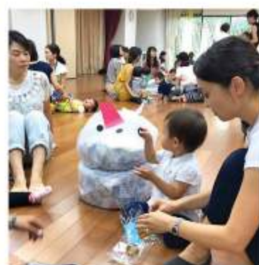
目と鼻をつけたら、あれ?これは お弁当バスに乗りまーす