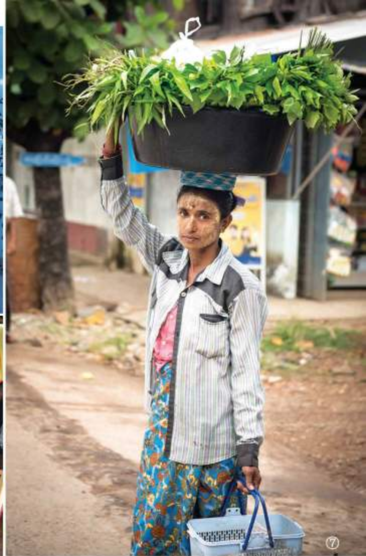
⑥コウモリ洞窟 ⑦⑧市場にて ⑨カレン族の村にて