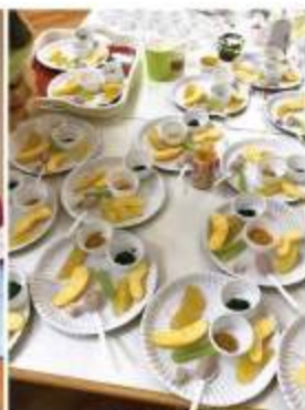
いつも好評な試食。毎回違うので何度もご参加ください