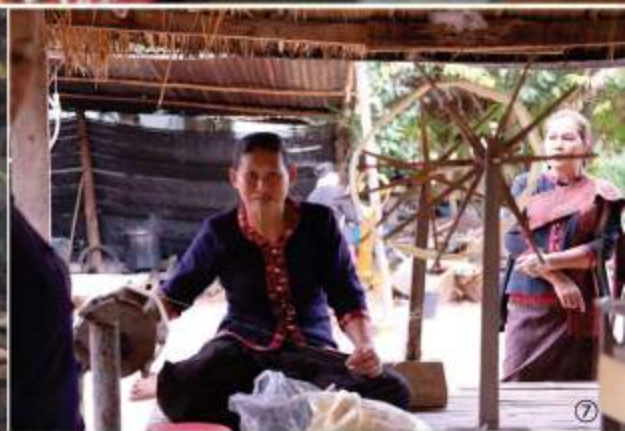
①着物の帯のような風格の「プレーワー」 ②織るときに見えるのは裏面。難易度が高い ③食欲旺盛な蚕。桑を食む音が聞こえる ④印象的な赤色はクランという小さな虫由来の染料で染める ⑤タイの繭は黄色くて日本の繭より細長い ⑥白い糸は一般的なタイ蚕とは別品種の蚕で飼育が難しい ⑦糸になるまでには多くの工程をふむ