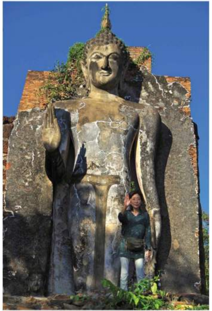
サパーン・ヒン山上のアッターロット仏

では、ダムロン殿下の『シヤムにおける仏塔縁起』(BKK 1926)が典拠として挙げられている。