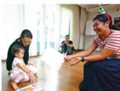
.....12月18日(火) 投稿/島本道子

クリスマスに因んだカード探しや簡単なツリー作り、親が思うようにはなかなか動かない子どもたち。だけど親が思うよりもきっと、色んなことを吸収している子どもたち。ママ、連れてきて一緒に遊んでくれてありがとう！