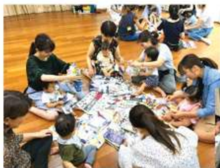
紙を盛大にビリビリビリ〜