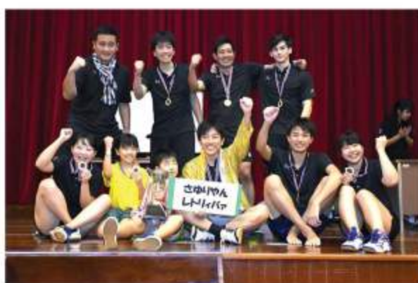
Aリーグ優勝は、さゆりやんレトリィバァ！