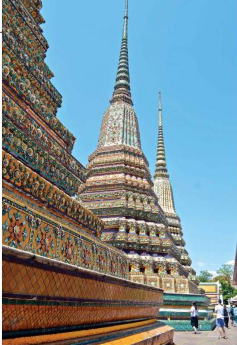
ワット・ポーのラーマ1世仏塔 (シー・サンペット仏塔)