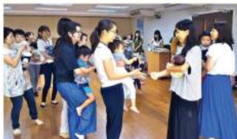
じゃんけん列車をして、お知合いの列が長く繋がりました