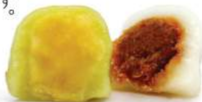
なめらかな緑豆餡(左)、旨味のあるココナッツ餡がコシのある餅生地の中になかになめらかな

蛇足ですが、タイのハゲ頭は7種類に分類され、それぞれ呼名があることをご存知でしょうか。たとえばザビエルハゲはチャド・ティー・プレーン、チャドの地ならし。チャドという大型ライギョはヒレで川底をたたくようにしてくぼませ巣を作ることからそう呼ばれているそうです。また、すっかり後退して耳の周辺から襟足にかけてのみ毛髪が残るタイプはトウン・マー・ロン、犬も迷う野原。同じ後退スタイルでも度合いが低いのはドン・チャー、カム象の渡る森。タイの風土が匂い立つ見事な名称に脱帽です。カノム・フアラーンのようなツルピカは七つの中に含まれませんが、スリヤン・モット・メーカー、雲ひとつない太陽(意訳)という表現もあるそうです。