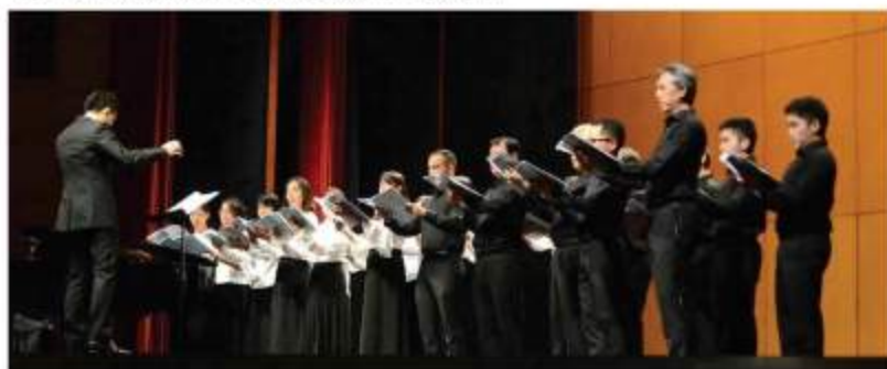
全曲をピアノ伴奏のみで歌い切ったモーツァルト『レクイエム』