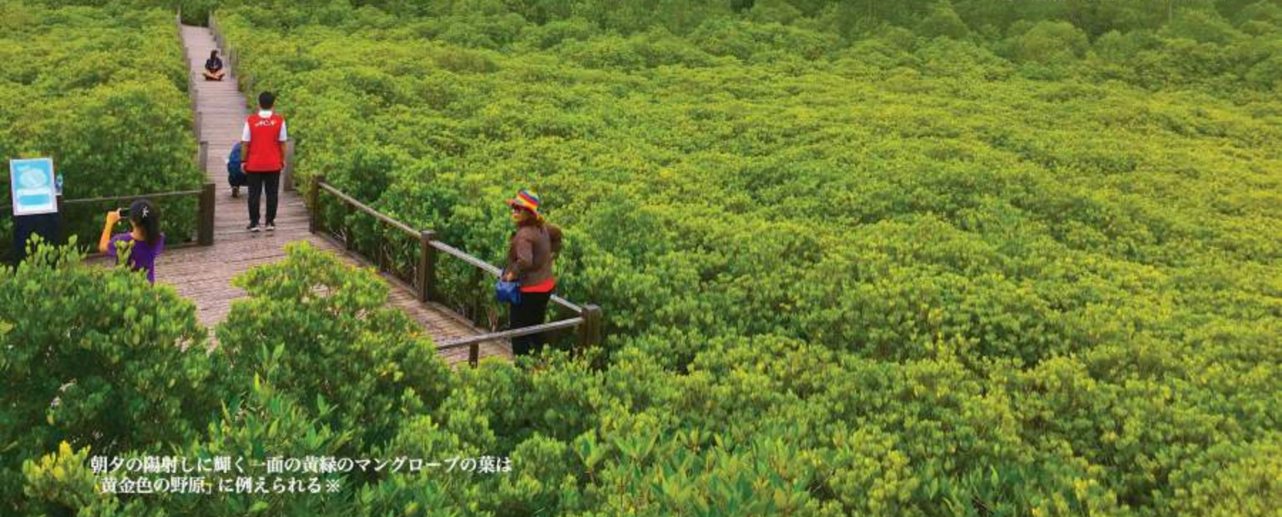
朝夕の陽射しに輝く一面の黄緑のマングローブの葉は「黄金色の野原」に例えられる※