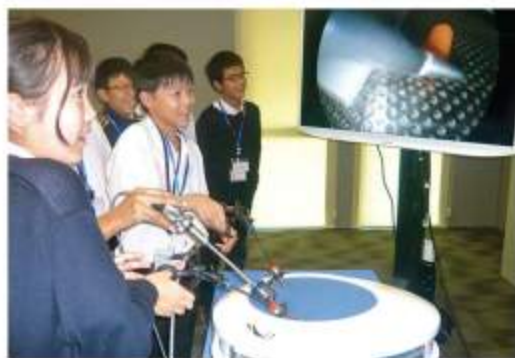
医療実習施設 (オリンパス T-TEC)

「多文化理解学習」の一環として、今年も泰日協会学校の中学1年生が、政府開発援助ODAの大型プロジェクトや、企業や国際協力機構JICAの日本人専門家が活動する現場を訪ねました。見学先は、スワンナプーム国際空港、レムチャバン港、都市鉄道パープルライン、内視鏡の医療実習施設、それに洪水対策現場と高齢者支援施設が加わって6コース。ODAの最前線で生徒たちは何を見つけ、現場で迎えた担当者は何を託したのか。それぞれの思いがぎゅゅとつまった恒例の特集です。