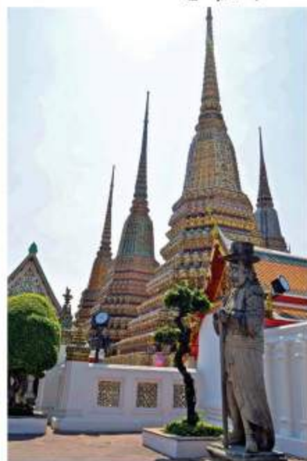
ラーマ1世、2世、3世仏塔

ては、アユタヤーからシー・サンペット仏を将来し、ローカナート像のように以前の姿に戻して安置するという(ラーマ1世の)ご意向(チェタナー)があった。ちなみにローカナート(世尊)像は、先にシー・サンペット寺から運ばれ、修理され、今もチェットポン寺の本堂前、東の仏殿に金色燦然と鎮座なされている。