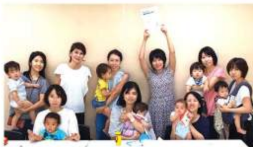
1月23日(水)に2月号「もうすぐソクラン! 常夏のバンコクで水と遊ぼう!」の入稿作業を行いました。この日でメンバー1名が卒業しました。すくすくだよりはどなたでも別館で購入可能です

2月8日(金)におしゃべりサロン「テーマ:タイの魚缶詰を活用しよう」を開催しました。ゲストの方4名にもご参加いただき、実際に試食もして大好評でした!