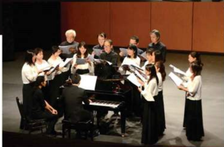
『大地讃頌』は外国人来場者にも好評