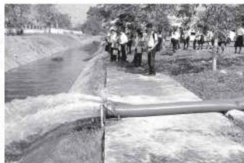
洪水対策現場見学

参加した生徒の皆さんは、過去から現在、未来へつながる日タイ協力の歴史と共に、様々な国際協力の取り組みを学んでいた。タイに暮らす一人の生活者として