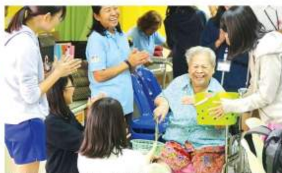
高齢者支援施設 (デイケアセンター)

文化理解学習の一環として、今年も泰日協会学校の中学1年生が、政府開発援助ODAの大型プロジェクトや、企業や国際協力機構JICAの日本人専門家が活動する現場を訪ねました。見学先は、スワンナプーム国際空港、レムチャバン港、都市鉄道パープルライン、内視鏡の医療実習施設、それに洪水対策現場と高齢者支援施設が加わって6