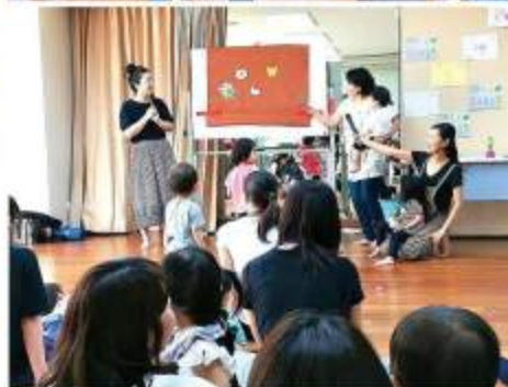
パネルシアターの鳴き声クイズに、「たぬき〜!!」と元気に答えてくれました