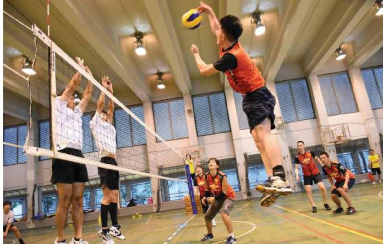
みんなで拾ってつないで、渾身のスパイク！

14チーム総勢140名が参加した今大会。工夫を凝らしたユニフォームを身にまとい、熱戦が繰り広げられました。