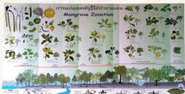
マングローブの植物相を紹介するパネルには英語表記もあり葉や実の特徴も分かりやすい※

ラヨンへはバンコクから直通のバスを使って所要時間は3時間程度。パタヤ経由もありますが、時間が倍近くかかることがあるので行先に注意。