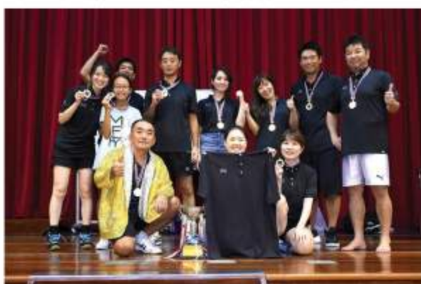
Bリーグ優勝は、スーパータケダゲテモノ (ななみ) 動物園！