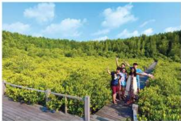
表紙:トゥン・プローン・トーン 場所:ラヨーン県グリーン郡 パークナムプラセー

約9600km 2 の広大なマングローブ林トゥン・プローン・トーン(直訳すると金のヒルギ野)。陽射しを浴びて金色に輝く幾万の木々の葉の様から名づけられたそうです。特に輝きを増すのが朝夕。インスタ映えするエコツアーの地としてタイの人たちにはすでに人気です。遊歩道を歩くと様々な生き物の気配がして生態系を感じながら森林浴を満喫できます。ラヨーン市の街中から60km強。保護すべきタイの湿地の一つに数えられています。