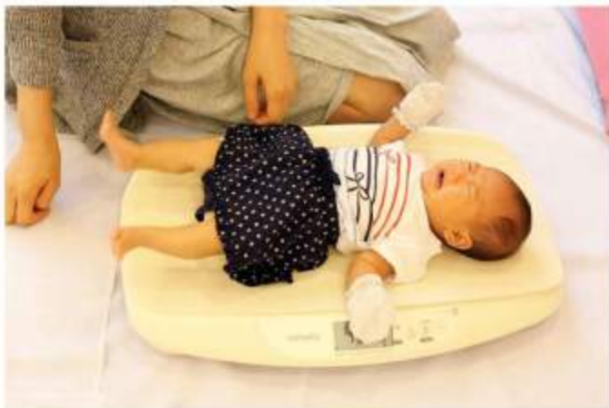
体重計を購入しました。いつでも、測定に来てください