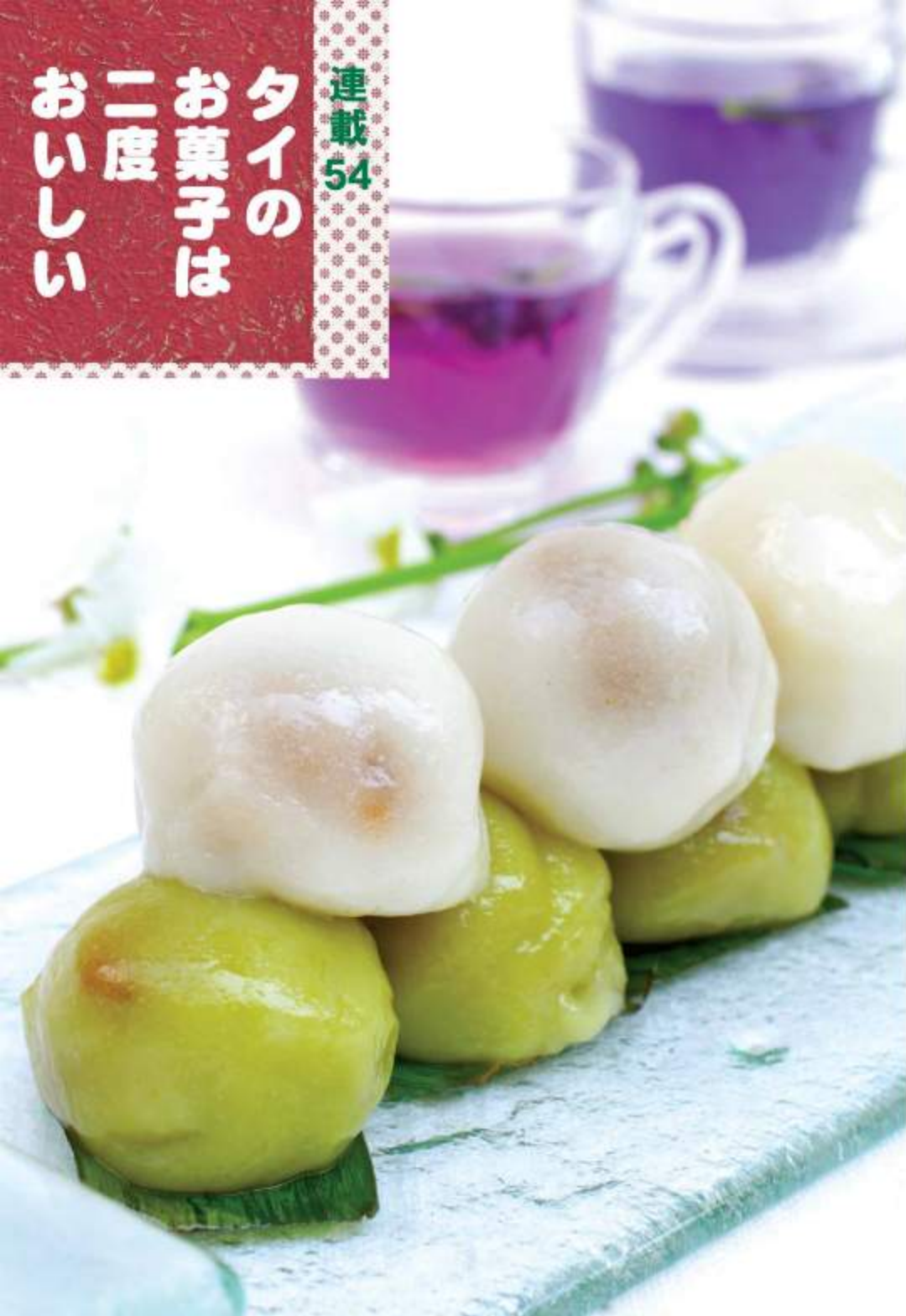
市場で求めたカノム・フアラーンขนมหัวล้านは直径約35ミリ。小さいびつなところが「ハゲ頭」らしい