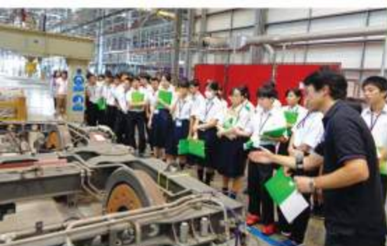
地下鉄パープルライン

「多文化理解学習」の一環として、今年も泰日協会学校の中学1年生が、政府開発援助ODAの大型プロジェクトや、企業や国際協力機構JICAの日本人専門家が活動する現場を訪ねました。見学先は、スワンナプーム国際空港、レムチャバン港、都市鉄道パープルライン、内視鏡の医療実習施設、それに洪水対策現場と高齢者支援施設が加わって6コース。ODAの最前線で生徒たちは何を見つけ、現場で迎えた担当者は何を託したのか。それぞれの思いがぎゅゅとつまった恒例の特集です。