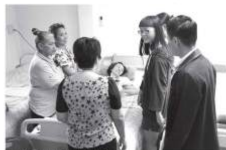
高齢者支援施設見学

スワンナブーム空港やレムチャパン港のように何十年も前に協力したタイの経済発展に大きな貢献をしてきたプロジェクトもあれば、現在のバンコクの渋滞緩和・気候変動に貢献する鉄道プロジェクト、タイ人医師が最先端医療技術習得を支援するプロジェクト、タイの行政・病院・地域と連携して高齢者への介護サービスを立ち上げるプロジェクトなど、日本がタイに行っている支援は多岐にわたります。