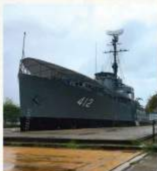
汽水域のマングローブ林の中、遊歩道を歩いていくと、かつて使われていた戦艦が。艦内も見学が可能※