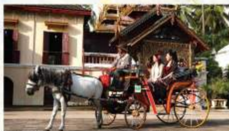
花馬車。馬車のゆったりとした歩みがラムパーンの街を体現しているよう

東南アジアの先住民族として紀元前より独自の文化を保持していたモーン族。そのハリプンチャイ王国の副都として発展したラムパーンは、後にクメールやランナー・タイ、ビルマの各王朝による支配を受け、様々な文化の影響が色濃く残る町です。こぢんまりとした町なかを、移動や散策をする際には、町の空気を感ずられる、名物の花馬車がおすすりめです。