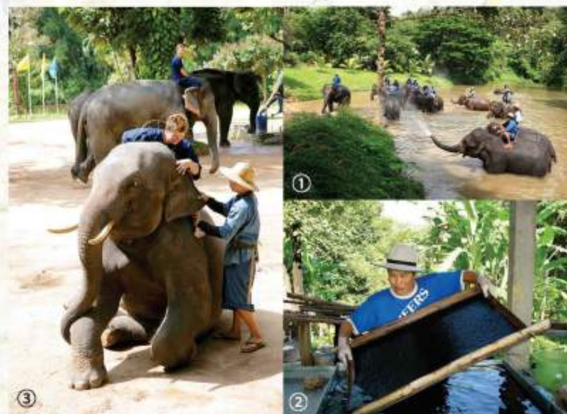
①水浴びショー ②象糞紙を作り販売 ③象使い学校での体験プログラム

Thai Elephant Coservation Center Elephant Hospital