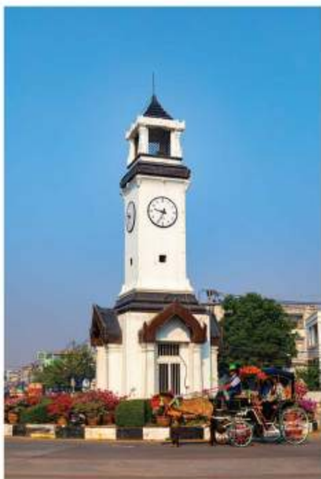
表紙：ラムパーン市の時計台と花馬車 場所：ラムパーン県

新市街の中心にある白い時計塔の前を花飾りをつけた馬車が観光客を乗せて、のどかに走っていきました。クメールやランナー・タイ、ビルマなど、様々な文化の影響が残る古都ラムパーンを、名物の花馬車に揺られて散策。