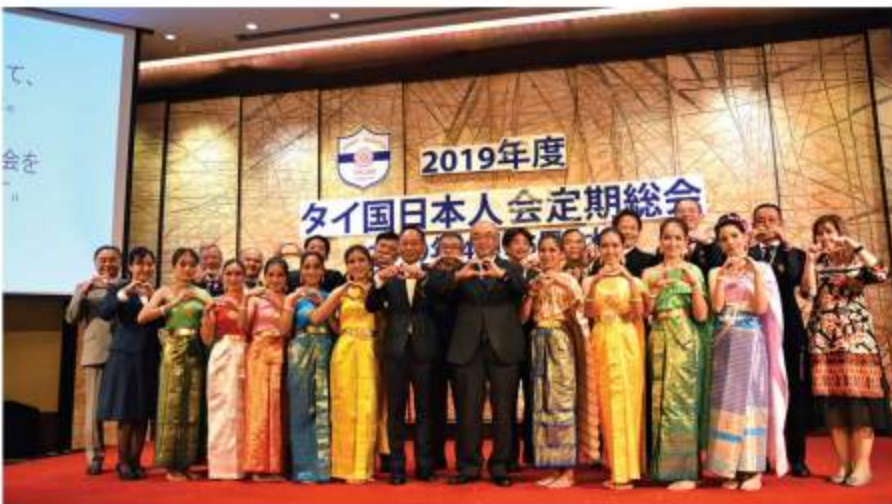
Wat Arun Community Learning Centerの奨学生と佐渡島大使、島田会長、理事の方々

去る4月25日（木）、ザ・ランドマーク・ホテル・バンコクにおいて2019年度タイ国日本人会定期総会が開催されました。第一部に引き続き行われた懇親会では、チャリティー寄付先である Wat Arun Community Learning Center によるタイ舞踊や、文化部の日舞・民舞・よさこい同好会による演舞、ゴスペルクワイヤー Phiriks による歌などが披露され、大いに盛り上がりました。