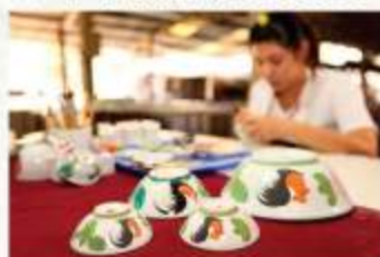
タイの食堂でよく見かける食器の「鶏」モチーフはラムパーン県の県章