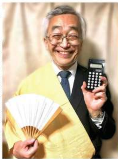
サラリーマンから落語家への転身を記念して撮った退職記念の一枚

気持ちよかったです！ 子どもの頃から人に見られるのが好きだったんですよ。次の9月公演は宇宙船の船長の役で7個の台詞があり、