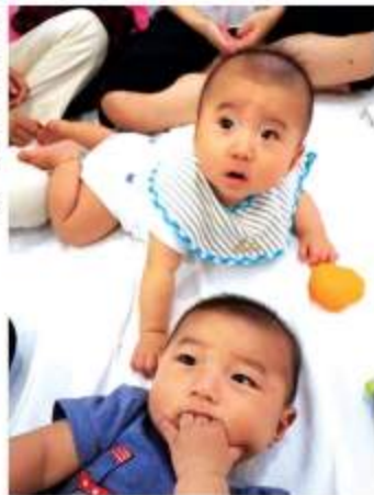
新しいおもちゃが増えました～遊びに来てね～♪

ア・デイリーホーム)、枝豆と紫玉ねぎのペースト、お野菜ビスケットと盛りだくさん！興味津々で食べてびっくりしている子もいました。