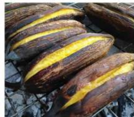
グルアイ・ハックムックは野生種とグルアイ・ターニーというバナナを掛け合わせた品種で、皮に筋のあるものとないものと2種あるそうです

芋のよう。甘みもサツマイモに近く、バナナを食べているとは思えない味わいです。驚いた顔を見て、店主はにつこり。