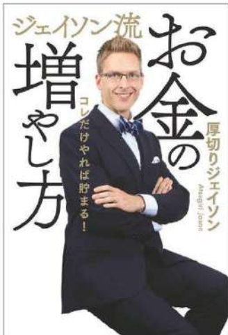
厚切りジェイソン=著