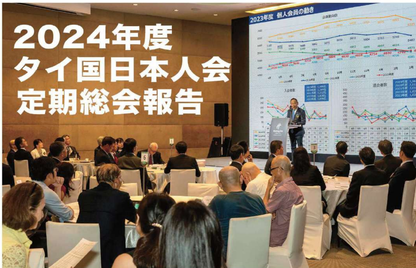
島田会長による一般報告と方針説明