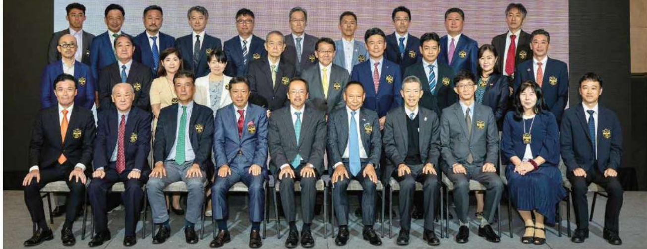
ご出席いただいた大鷹大使、理事・監事・オブザーバーの方々

を事務局主催のイベント日として、別館にて開催できるように設定いたしました。会議室の利用について、皆様にもご協力いただきありがとうございます。現在、フットネス、タイ語などを実施しておりますが、皆様からのご要望を取り入れ、タイ文化を学べる講座や、英会話レッスンなども企画していきます。