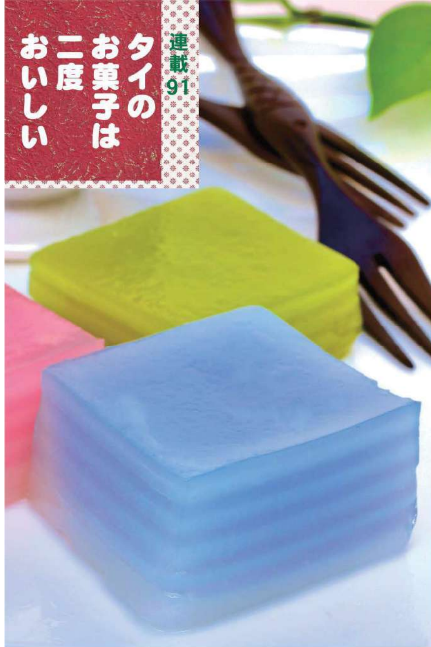
青いカノム・チャンは蝶豆の花、緑はパンダンの葉、ピンクは赤いシロップで着色