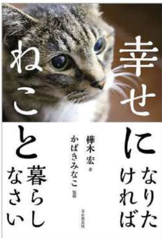
榊木 宏=著 かばきみなこ=監修