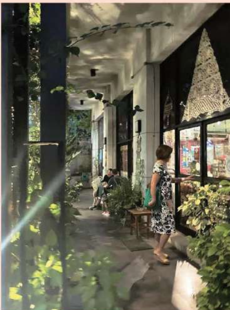
korekara (from now)