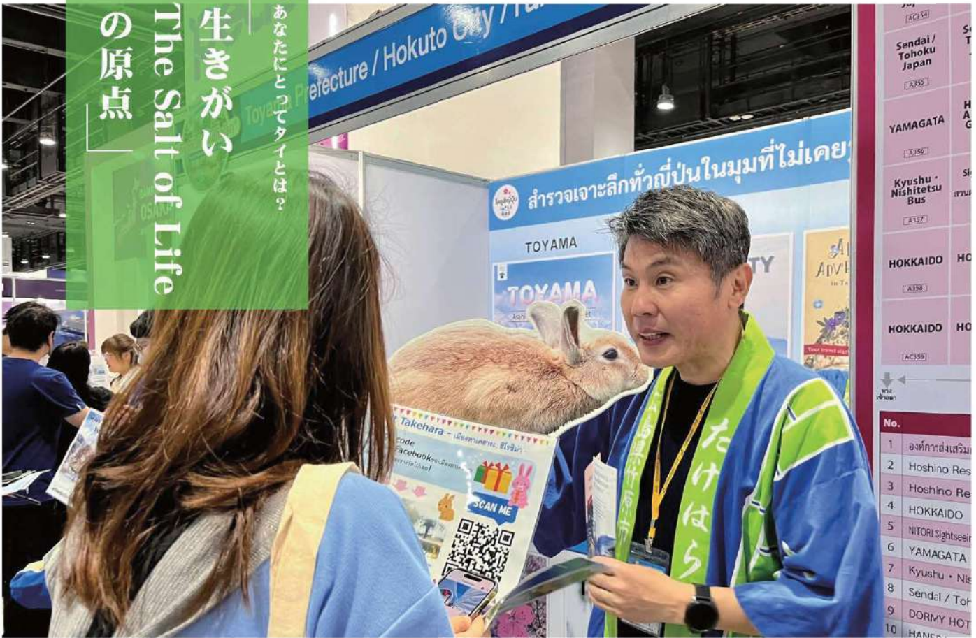
今年1月、バンコクで開催のイベントTITF (THAI INTERNATIONAL TRAVEL FAIR) に竹原市のブースを出展