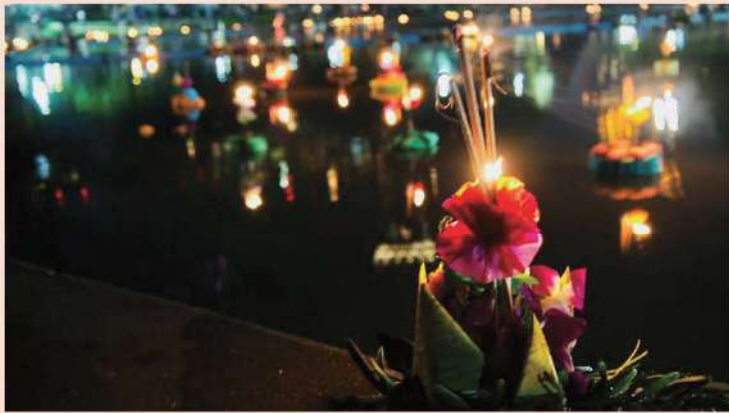
Loy Krathong 高橋昌也