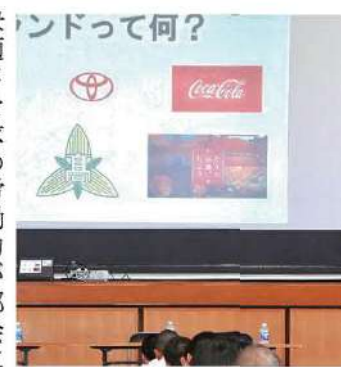
地元の高校の探究学習の授業で講演。持続可能な観光まちづくり

快適さを求め労働力が都会に戻りつつあったりし、労働人口の空洞化はさらに悪化し、竹原市は30年後の消滅可能性都市からまだ脱却できていません。こういった事情から、観光の側面から、関係人口や交流人口の拡大を目指しています。