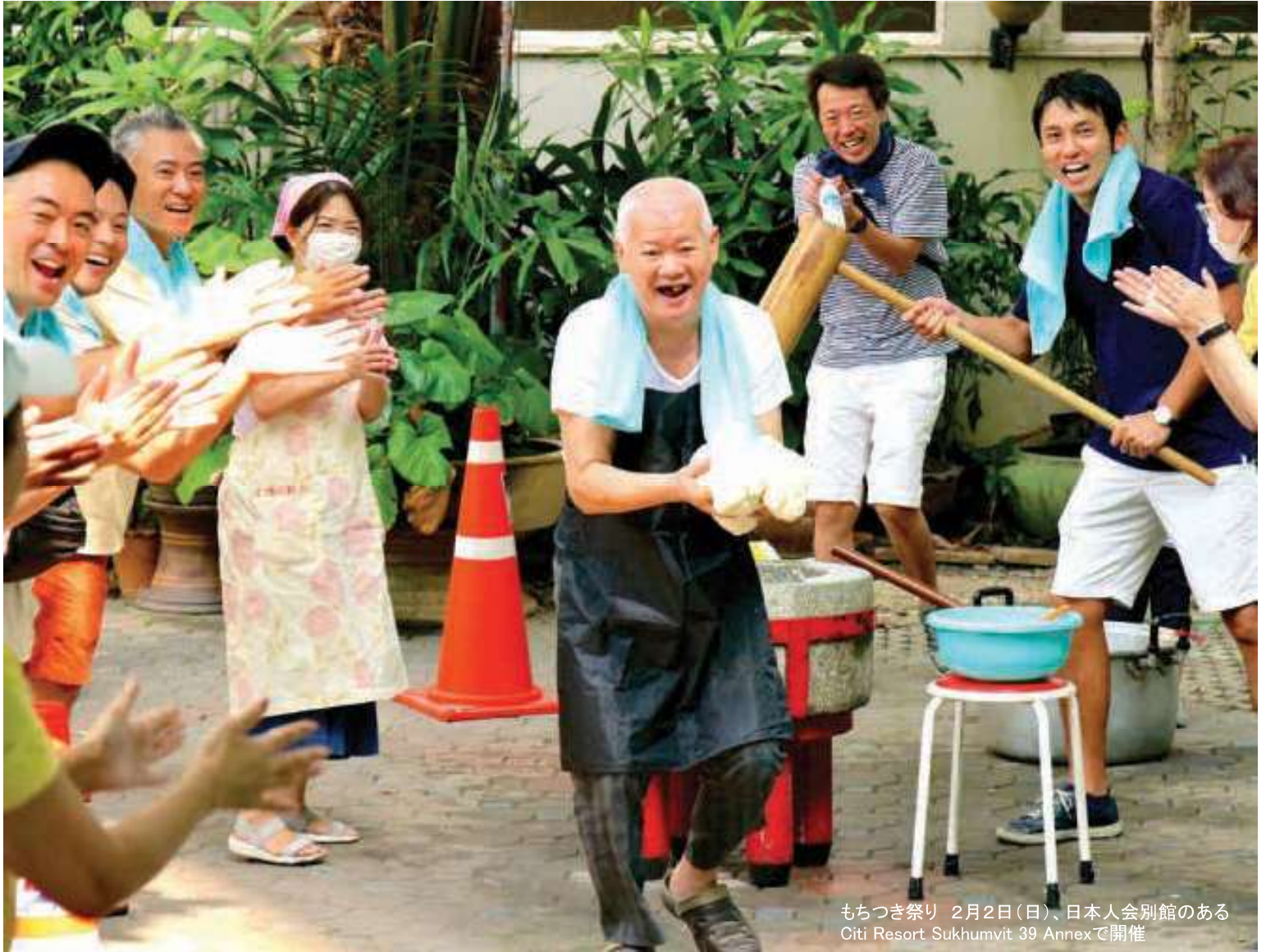
もちつき祭り 2月2日(日)、日本人会別館のある Citi Resort Sukhumvit 39 Annexで開催

タイ国日本人会 Japanese Association in Thailand