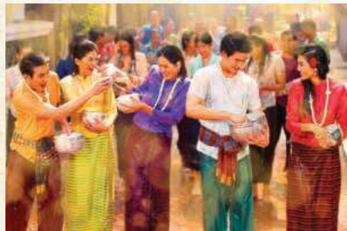
毎年園内でソンクランフェスティバルを開催。HP等でご確認ください