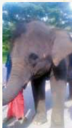
運が良ければ、園内で象に会えるかも

タイ国土の形をした 128万m 2 という広大な 敷地内に100を超える 建造物。ミニチュアであ りながら創業者の強い思 いで歴史に忠実に再現さ れた建造物は実際にタイ 全土の名所を訪れたよう な気持ちになります。 BTSの延伸によりぐ っと行きやすくなりました。 タイ在住のみなさま にこそ行ってほしいおす めスポットです。