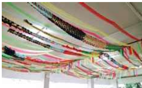
5年生：南アメリカ大陸「8mを超える布を編み合わせた巨大な織物」