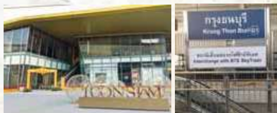
アイコンサイアムはジャルーンナコーン駅でクルントンブリー駅へ BTSと接続

2020年12月16日に新たにグリーンライン7駅が延伸し、ゴールドラインが開通しました。ゴールドラインはタイ国内初となる全自動無人運転車両 (APM) を採用。開放感のある大きな窓から景色を眺めながら、ゴトゴトゆっくり進む様は短い旅のよう。タイ最大級の複合施設であるアイコンサイアムや、国内唯一の日系デパートであるサイアム高島屋へのアクセスもグッと便利になりました。