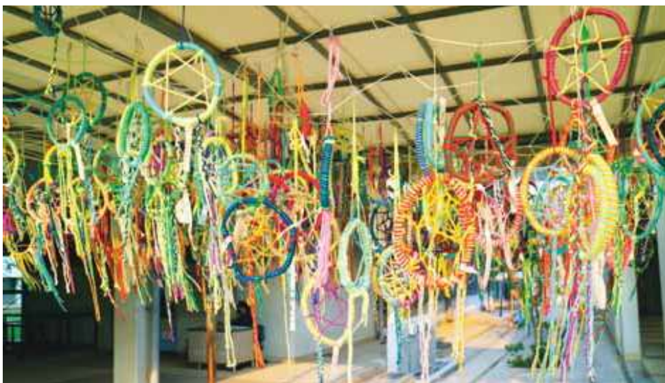
6年生：北アメリカ大陸「新型コロナウイルス過の現状を乗り越え、夢や希望を願う思いを込めたドリームキャッチャー」