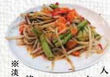
※淡水のカニは特に要注意ですね。

つけながら食べるのは最高！ まだタイに来て間もない頃、あるお店でカニ入りソムタムを注文したところ、生のカニが入っていてびっくりしましたが、