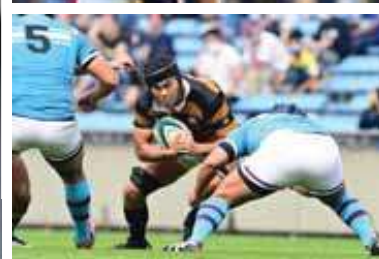
左：第57回全国大学ラグビーフットボール選手権大会 準々決勝 対早稲田大学戦（2020年12月19日） 上中：2020年度関東大学対抗戦 対明治大学戦 下：同 対筑波大学戦