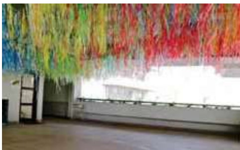
2年生：オーストラリア大陸「グレートバリアリーフやブルーマウンテンを参考に、5色のすずらん紐を結び合わせた作品」