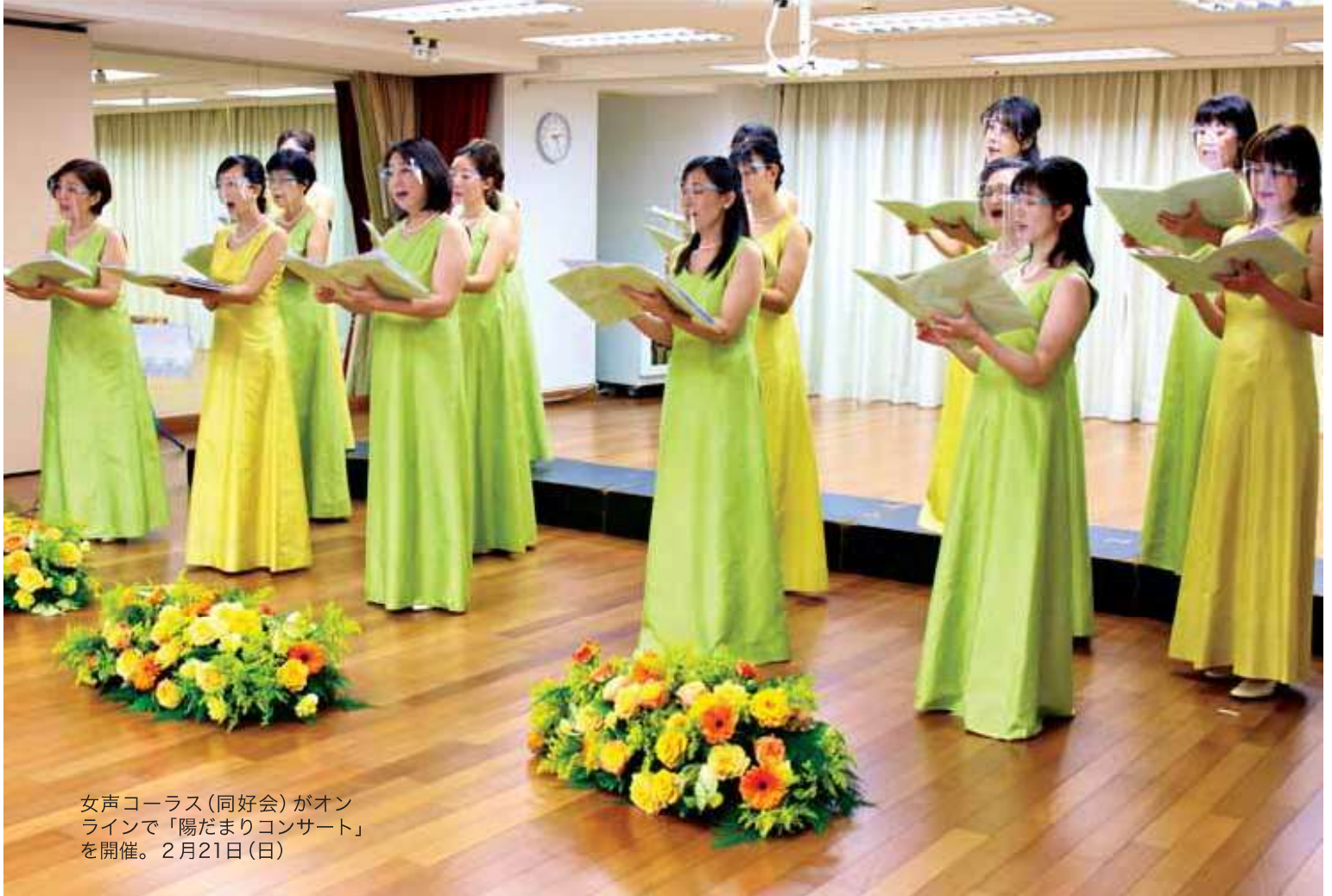
女声コーラス(同好会)がオンラインで「陽だまりコンサート」を開催。2月21日(日)

タイ国日本人会 Japanese Association in Thailand