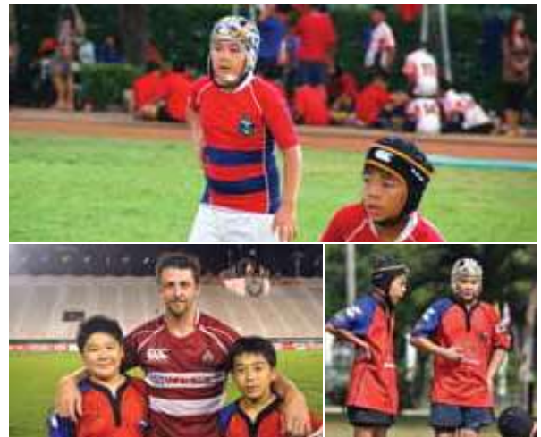
バンコクではラグビー同好会のキッズラグビーチーム、インター校のラグビークラブなど複数のチームに参加

——インター校での生活は？ インター校には様々な国の子がいて、カルチャーショックを受けました。たとえば日本人学校では他の国の子と食事をする機会はないじゃないですか。でもインター校はカフェテリアがあつていろいろな国の子たちが食事をしている。その中でイスラム教徒の子はハラールフードを持つてくるんです。厳しく戒律を守っているんだなあ小学生ながら驚きました。 最初は英語での授業についていけなかったし大変でしたよ。でも半年くらいで慣れました。中学になったとたんに課題もパソコンだし、パワーでプレゼンする。日本では授業といえれば座って聞くことでしたが、インター校ではアウトプットすることが多かったです。様々な文化に触れて価値観の多