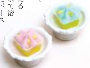
本体は緑豆粉製、上のクリームはココナッツミルクと米粉を煉ったもの