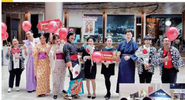
仮装したスタッフが商業施設内を練り歩き、子どもたちに風船をプレゼント