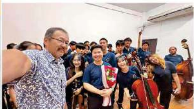
子どもたちが生まれた「イヌエラ」のメンバーと ラムのオーケストラのメンバーと バンコクのオーケストラのメンバーと

タイに対する日本の政府開発援助（ODA）が開始されてから70周年を迎え、バンコク日本人商工会議所（JCC）やJETROバンコク事務所も設立70周年を祝いました。また、国際交流基金（JF）が設立50周年を迎え、これまでの両国の文化交流や教育面での協力を改めて確認する機会となりました。これらの節目を通じ、経済、文化、教育、技術など、幅広い分野で築かれた両国の連携の歴史に感謝し、その発展を今後も継続していく重要性を実感しました。