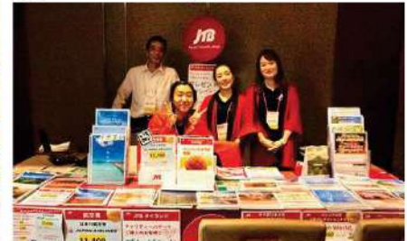
JTB (Thailand) Limited