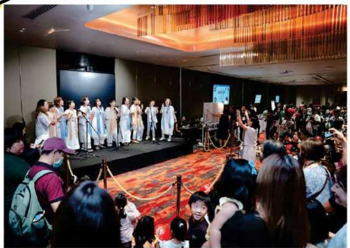
ゴスペルクワイヤーPhriks ミニコンサート

コラムp9・p11 インタビュー/ムシカシントン小河修子 p9  p11