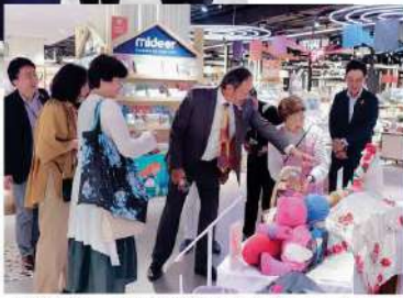
編み物・手芸の会の展示コーナー