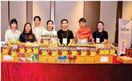
Yamamori Trading Co., Ltd.