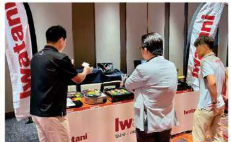
Iwatani Corporation (Thailand) Ltd.