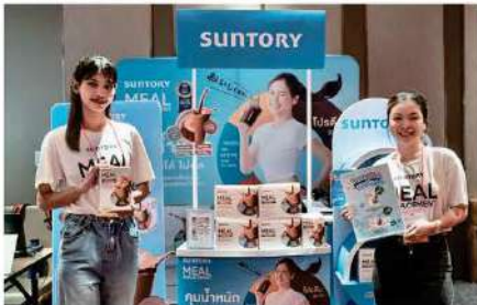
Suntory Wellness (Thailand) Co., Ltd.