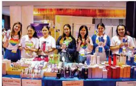
Kose (Thailand) Co., Ltd