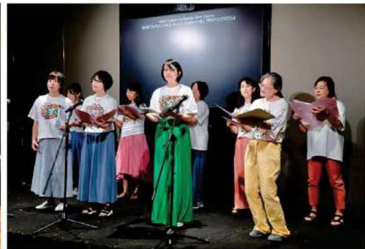
女声コーラス ミニコンサート