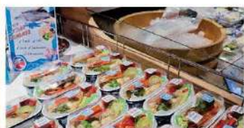
大人気だったアジアズキ