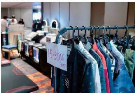
Toyotsu L&C Thailand