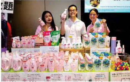
Saraya International Thailand