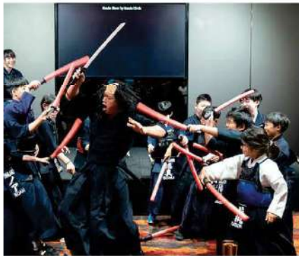
剣道サークル 演武・寸劇・体験