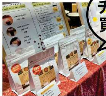
AKHA MAECHANTAI COFFEE