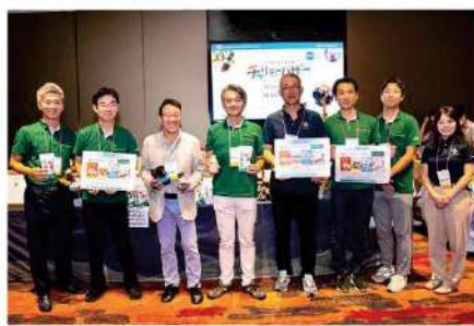
Mitsui & Co., (Thailand) Ltd. & SMBC