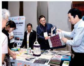
FEEMUE (Sikkha Asia Foundation)