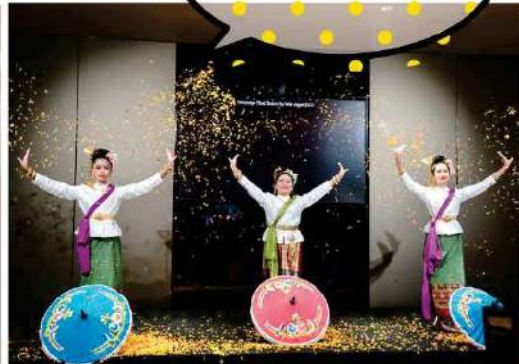
ワットアルンCLCウェルカムタイダンス