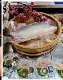
3キロ強のアジアスズキと刺身

ですが、その後次の段階の研究を進めていまして、私たちがプロジェクトでは成長が早く病気に強くなるよう育種し、代替餌の開発などに取り組むことにしました。餌は小魚、魚粉、それに大豆とトウモロコシの油の搾りかすです。動物性タンパク質が多いとおいしくなるのですが、私たちのプロジェクトでは安い餌でいい魚を育てる研究を重ねてい