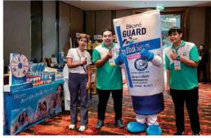
Kao Industrial (Thailand) Co., Ltd