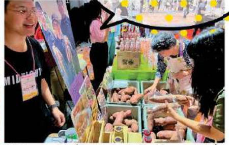
bijin tomato (Japan Agri Challenge Asia)