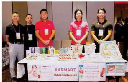
Marubeni Thailand Co., Ltd. (KARMART)