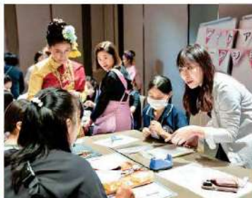
Wat Arun Community Learning Center