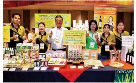
Harmony Life International Co., Ltd.