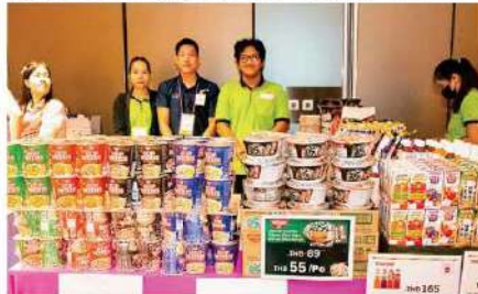
Nissin Foods (Thailand) Co., Ltd.