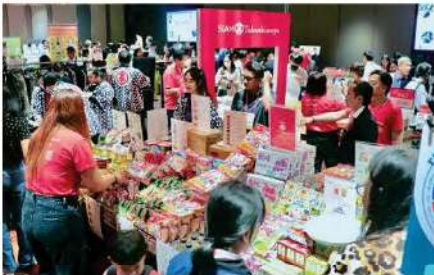
Siam Takashimaya (Thailand) Co., Ltd.