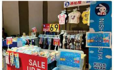
H. I. S. Tours Co., Ltd. (Thailand)