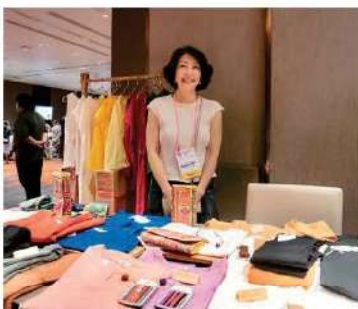
BAN ROM SAI

七つのチャリティー団体が 出店。午後にはステージで 各団体の活動内容についてお 話いただきました。