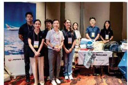
Japan Airlines Co., Ltd.