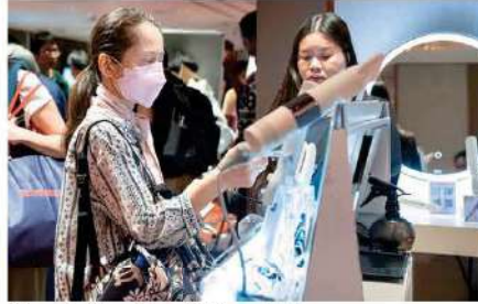
Kinujo (Thailand) Co., Ltd.