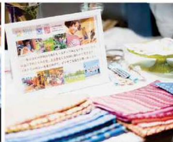
Rainbow School (虹の学校)