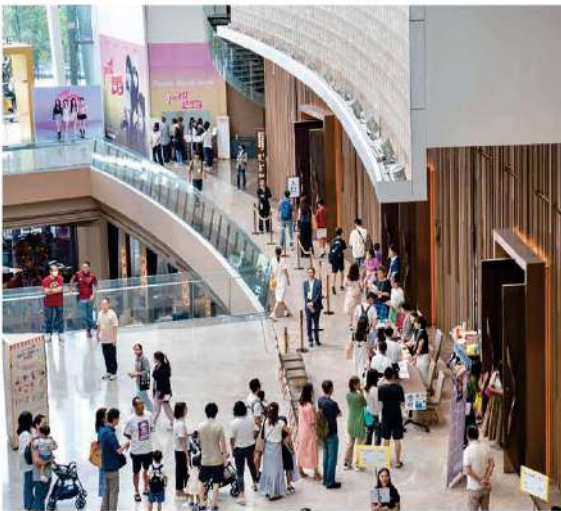
商業施設ICONSIAMのイベントホールで開催

現金・商品寄付の総額は83万バートル以上、純利益は96万バートル以上となり、昨年の純利益額を大幅に更新。出