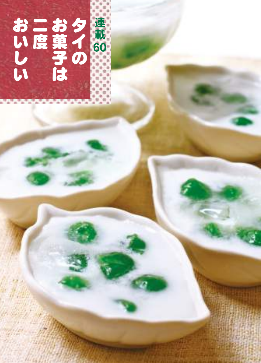
カノム・インタニン ขนมอินทนิล