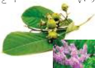
インタニン (Lagerstroemia speciosa (L.) Pers.) の実と花

菓子名の「インタニン」は樹木の名称で、和名はオオバナサルスベリ。血糖値を下げるお茶・痩せるお茶として知られているバナバ（葉をお茶にする）のことですが、それがなぜお菓子の名前になったのでしょうか。老舗菓子店に尋ねても、専門家が教える料理番組を見返しても由来は分からずじまい。そこでペツブリ通りに行ってみることにしました。インタニンは街路樹として植えることの多い樹木で、ペツブリ通りにもインタニン並木があるのです。花はほとんど咲いていませんでしたが、ほんの少し残っていた明るい紫色の花房に、緑色の玉のような蕾を発見。また、いくつかの木には丸い緑色の実（種）がっていました。名前の由来は蕾か実か、はたまた別にあるのか、出口のない悩ましい問題です。