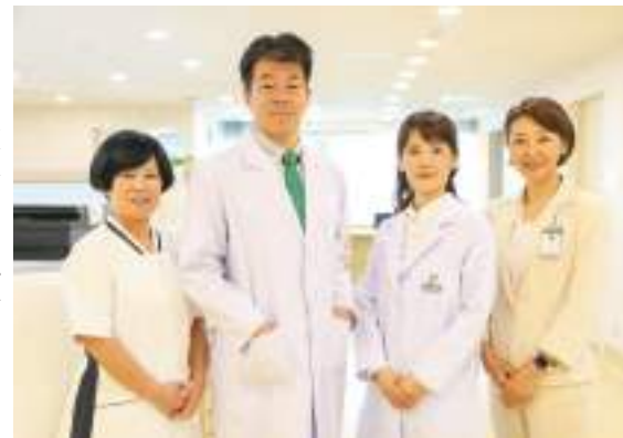
【写真1】 ジャパニーズ・メディカル・チーム

もう一つ日本との違いは、割とすぐに入院になり、薬もよく使われる傾向がある印象です。これについてはこちらの医師とも話したのですが、「やさしさ」から来ていることが分かってきました。日本だとかぜならかぜ、胃腸炎なら胃腸炎と割り切り、よほど状態が悪化しない限り現状維持、なにかあったらまた来てくださいなのですが、こちらの先生は、もしかしたら脱水で急変するかもしれないとか、それこそ検査値でも一つ一つを気にして、何か見逃している重大な病気がないかと心配しておられます。そのため、ついその心配している病名を口に出したりして、親御さんはえっ!とびっくりする場面を何度か見聞きました。また、日本であまり見ないチフ