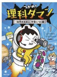
シン・テファン=著

ピカチュウが放つ「10まんボルト」の電撃はどんな威力なのか？「レックウザはオゾン層で隕石を食べる！得られるエネルギーは!？」など、ポケモンたちの能力や特徴は、理科の面白さに満ちている。オドロキと爆笑の科学入門シリーズ第1弾！