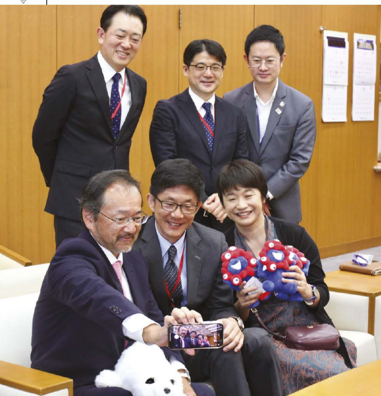
大鷹大使が自撮りで記念撮影。前列左から大鷹大使、富永前編集長、川村参事官、後列左から井上編集長、村上事務局長、久保木三等書記官

——今日はありがとうございました。(2024年5月20日 於、在タイ日本国大使館)