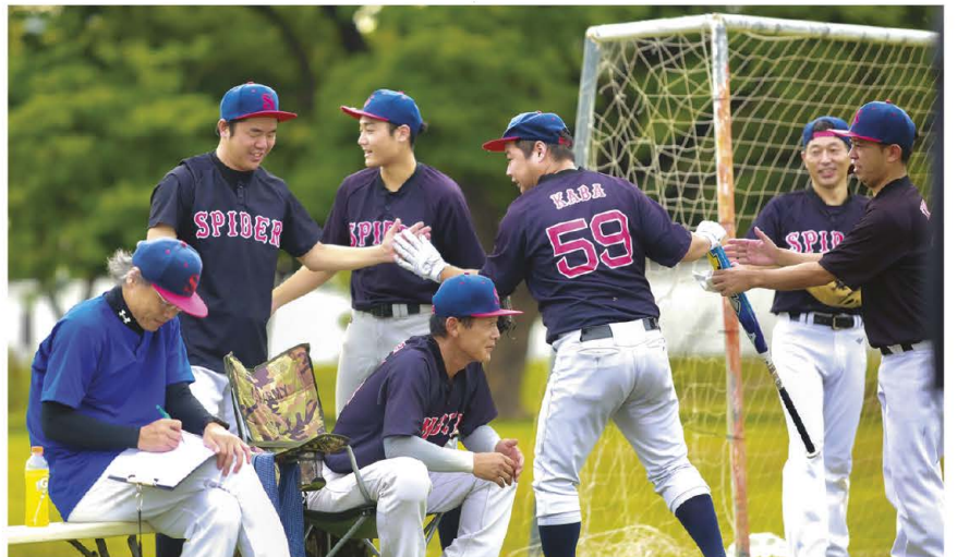
SPIDER α 6月23日(日)