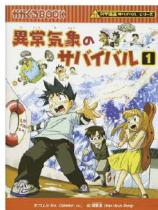
ゴムドリ co. 韓賢東=著