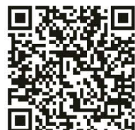
一般図書館リクエスト本応募フォーム

一般図書館では、年に4回、会員の皆様からのリクエストをもとに新刊図書を購入しています♪リクエスト本の応募がオンラインでもできるようになりました！別館一般図書館内と図書館の入口にもQRコードを掲示しています。入れてほしい本があれば、ぜひリクエストしてください！