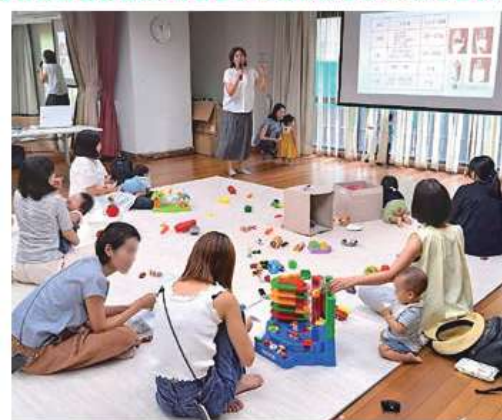
1日に必要な栄養の摂り方を具体的にレクチャー