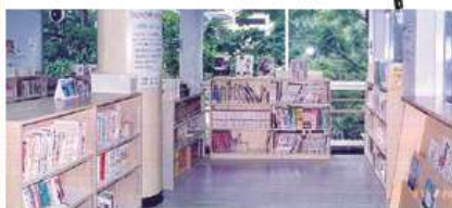
内装と什器の設計も手がけた子ども図書館