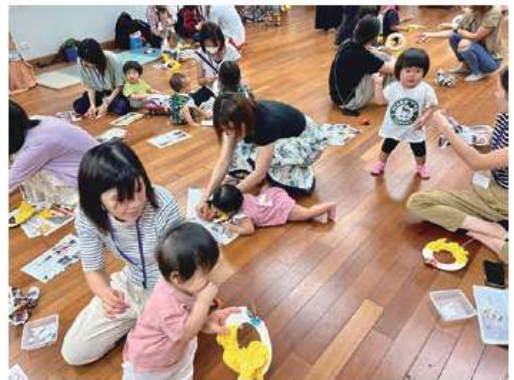
紙を丸めて「豆」を作って、子どもたちみんなで鬼をやっつけました