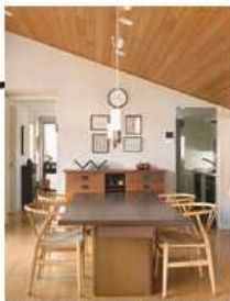
自ら設計した自宅。ジムトンプソン・ハウスで出会った4枚のカードを飾っている