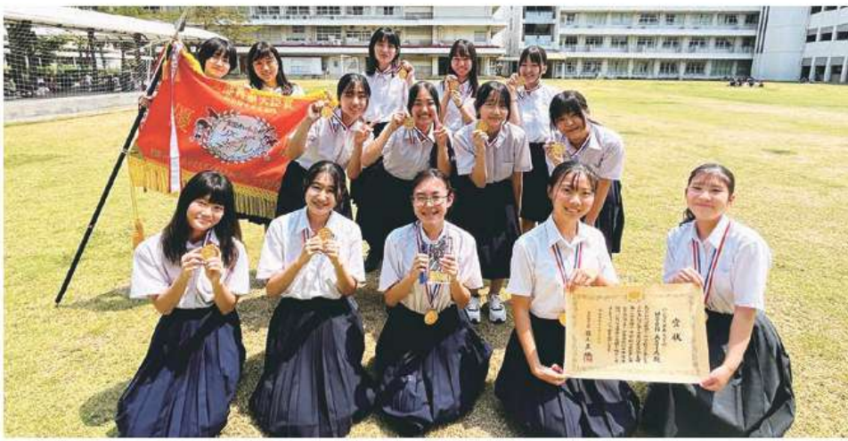
文部科学大臣賞受賞のMOON ASIAに賞状とメダル、優勝旗が届いた