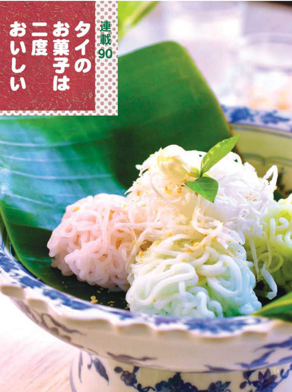
カノム・レーライขนมレーไร。レーライは蝉の一種。学名 Tosena melanoptera

らには形が巢(ラン)のようだからだとか。このお菓子はジャスミンの香りが大切な要素で、花を浮かべて香りを移したジャスミン水で粉をこねるレシピもあります。今回の店はジャスミンのつぼみを一粒、お菓子の上に乗せていました。包みを開けるとふわっと漂う生花の香りは清々しく、白いつぼみは初々しく、思いがけず特別な時間になりました。