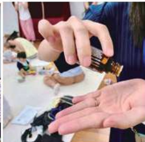
アロマの香りに包まれながらヨガを