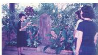
ジムトンプソン・ハウスでのガイド