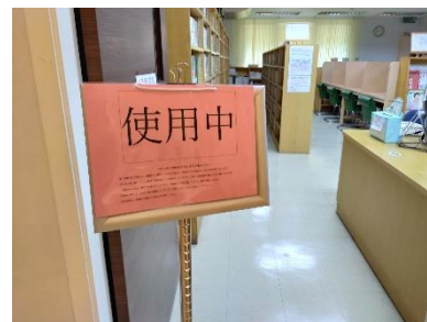
② 使用中の場合は待合室へ