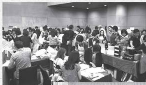
大盛況のバザー会場