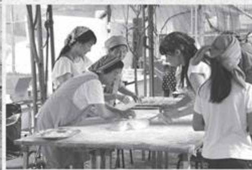
つきたてのおもちを丸めます