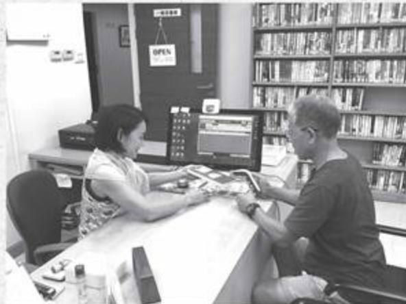
カウンターの貸出・返却手続き

月に2回程程度の3時間、スクムビット別館の図書館内カウンターで、貸出・返却手続きのお手伝いをしていただいています。年4回開催の図書ボランティア会議では図書館運営や新規購入書籍の選定についてご意見をいただくことも。1万2000冊の本に囲まれて、読書を楽しみながらボランティア。読書好きにはたまらない環境です。月刊誌も置いてあります。