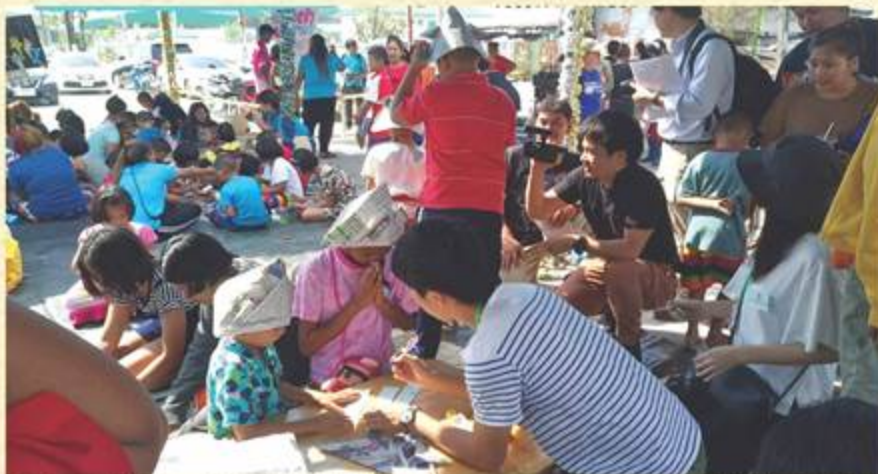
タイの子どもの日の活動。日本人ボランティアは折り紙や長縄跳びの活動で参加