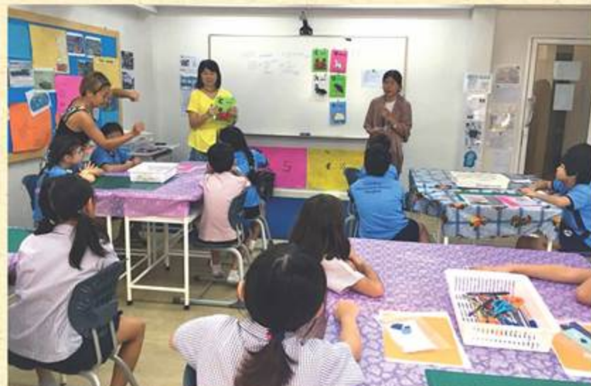
インターナショナルスクールでの触図絵本製作活動

のける活 活動を支 え、アーク の活動は 2010年 に全 山 地民への 教育支援 （職業 訓練、奨 学金、保 育園支 援など）。 持続型農 業の奨励 （「コーヒ ーの有機 栽培など のモデル 農場の運 営と農業 研修、見 学、植林 活動など の実施」） 。文化交 流活動、 スタッフ の受け入 れ。言語 、技術、 芸術、 体育等 得意分 野のある ボラン ティア 歓迎。 （備考 ：ゲスト ハウス あり、1 泊2食 付400 バーツ）