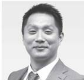
中水教仁 (なかみず・のりひと)