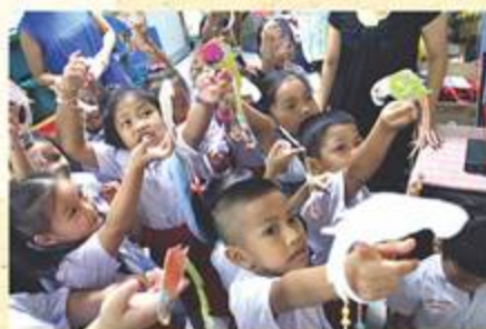
リサイクル工作(手乗りオウム)