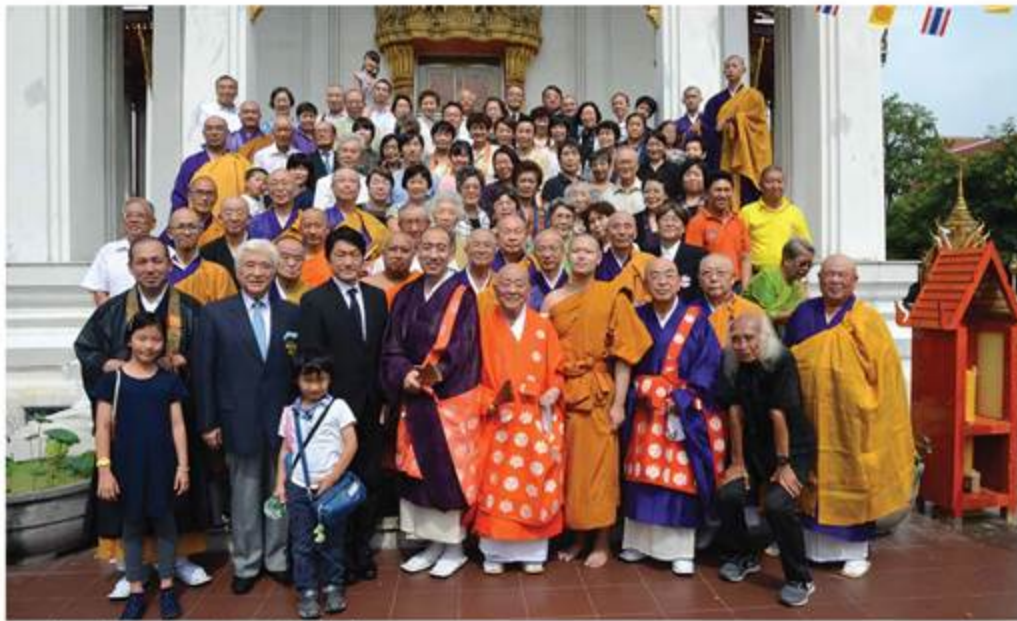
日本人納骨堂80周年年法会