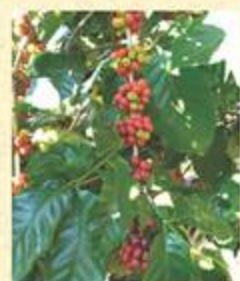
暁の家の山の畑のコーヒーの枝。赤く熟した実から収穫していきます