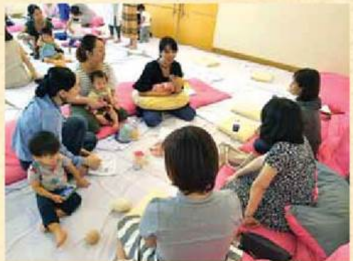
おっばいミーティング