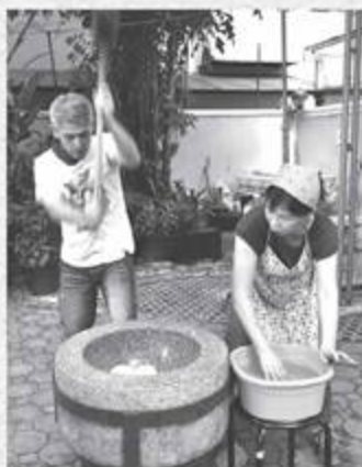
大きな臼でべったんこ