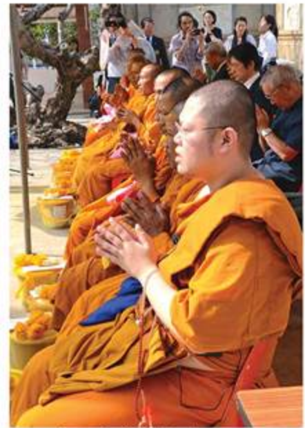
カンチャナブリ法要※

が奇跡で、そんな奇跡に感謝せずにはいられない。 一般的な堂守よりは多少長く滞在したが、それでもこの短い期間で多くの節目と出会った。まずは高野山開創1200年記念大法会（2015年4月2日〜5月21日）。高野山では50年毎に大法会というものが行われ