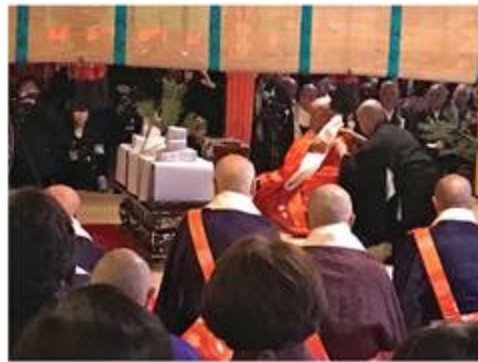
(右) 日本人会の人たちとともに高野山開創1200年記念大法会に (左) 法印転衣式

が奇跡で、そんな奇跡に感謝せずにはいられない。 一般的な堂守よりは多少長く滞在したが、それでもこの短い期間で多くの節目と出会った。まずは高野山開創1200年記念大法会（2015年4月2日〜5月21日）。高野山では50年毎に大法会というものが行われ