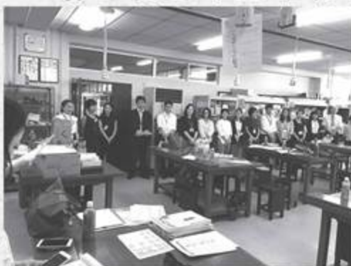
試験開始前の打合せ

英検受験の申込受付と試験監督のボランティアを募集しています。〈申込受付〉：申込書のチェックや受験料受領、資料配布等。お子様が英検を受験される保護者の方など、ぜひお手伝いください。〈試験監督〉：問題の配布・回収、時間内の見まわり、試験終了後の志願票記載事項の記入漏れ等の確認。英検受験者の方々が気持ちよく受験できるように、監督という立場で見守っていただける方。特にお子様が英検受験中にお手伝いをしただけの方を募集中です。