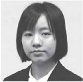
床嶋夏帆 (とこしま・かほ)