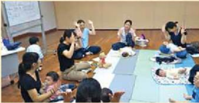
わんぱくミーティング