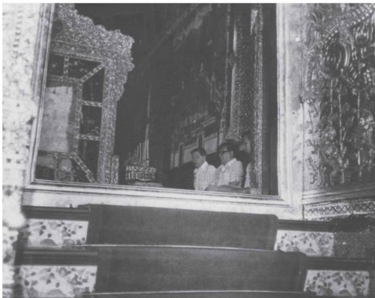
【写真1】王室守護寺院におけるマハー・チャート・カム・ルアン読経。僧侶でなく、4人の宗教庁役人による読経