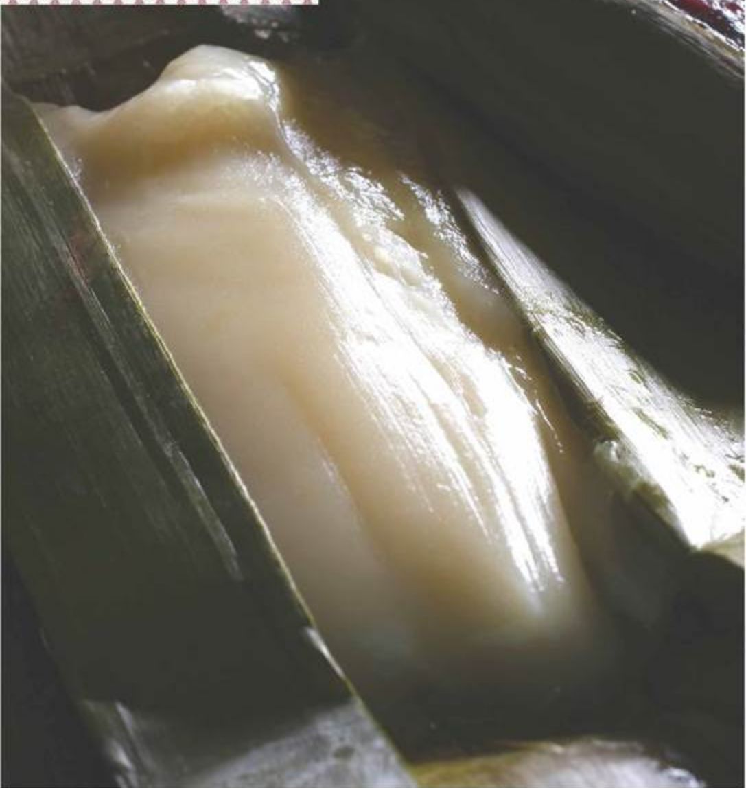
奥がラフ族の村でいただいた黒米粉のコエツ、手前がアカ族の村のポートウ