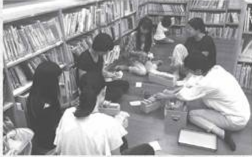
登録会員管理作業