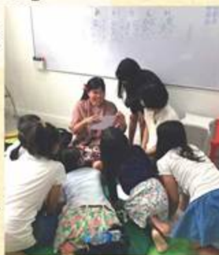
リーダソンイベントでの点字紹介

のける活 活動を支 え、アーク の活動は 2010年 に全 山 地民への 教育支援 （職業 訓練、奨 学金、保 育園支 援など）。 持続型農 業の奨励 （「コーヒ ーの有機 栽培など のモデル 農場の運 営と農業 研修、見 学、植林 活動など の実施」） 。文化交 流活動、 スタッフ の受け入 れ。言語 、技術、 芸術、 体育等 得意分 野のある ボラン ティア 歓迎。 （備考 ：ゲスト ハウス あり、1 泊2食 付400 バーツ）