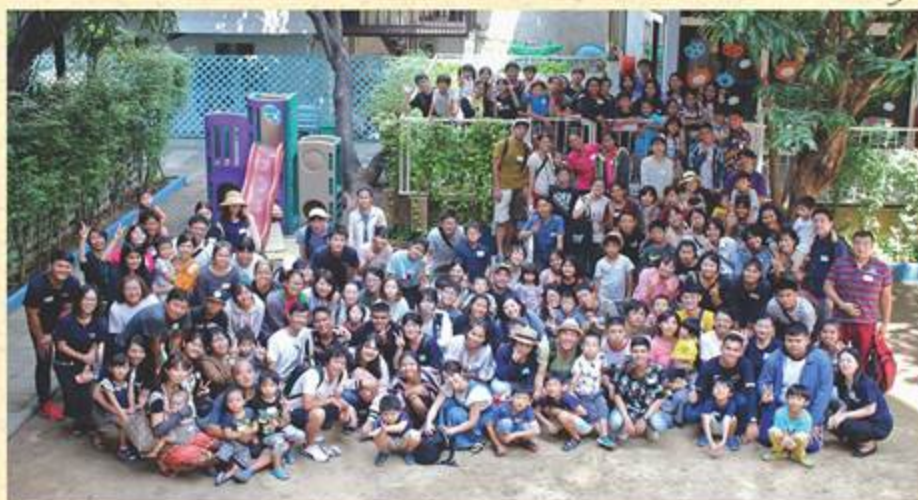
2017年12月、家族と学生のミニ交流会

タイの地方で日本語を学び、日本についてもっと知りたいと願う学生たちと、タイに住みながら、タイのことを知る機会がなく、もっとタイ人と触れ合いたいと願う日本人家族を繋げるプログラムです。2泊3日のホームステイを通じて、新しい繋がりが生まれ、それぞれ日本語を学ぶ意味やタイにいる意味を発見し、お互いにとっての「生きる力」になることを目指しています。