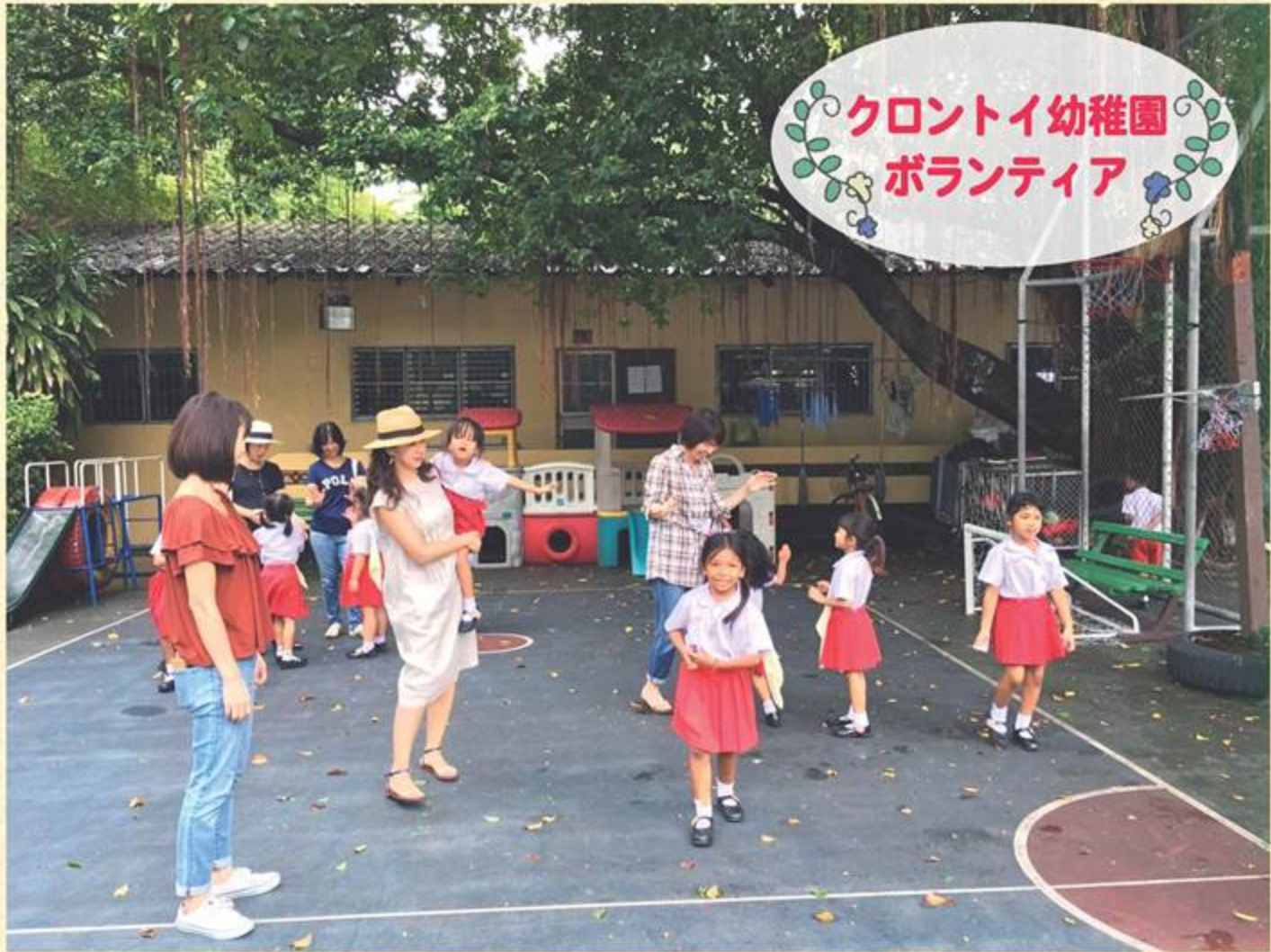
園庭で園児と遊んでいるところ