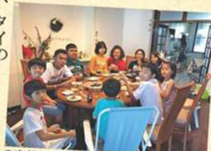
2家族合同でたこ焼きパーティー

タイの地方で日本語を学び、日本についてもっと知りたいと願う学生たちと、タイに住みながら、タイのことを知る機会がなく、もっとタイ人と触れ合いたいと願う日本人家族を繋げるプログラムです。2泊3日のホームステイを通じて、新しい繋がりが生まれ、それぞれ日本語を学ぶ意味やタイにいる意味を発見し、お互いにとっての「生きる力」になることを目指しています。