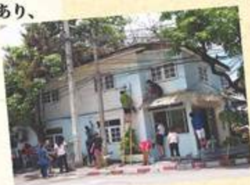
チュアパン図書館の改修作業。財団職員、地域の方、ボランティアが力をあわせて取り組みました

ボランティアの活動は、内容、頻度なども人それぞれです。図書館活動（読み聞かせ、芸術、語学、文化、劇、工作、料理等）開催や移動図書館の手伝い、事務所でのボランティア（奨学生のお手紙日本語翻訳）やクラフト事業に関する仕事（クラフト商品のイベント販売の際の手伝い、クラフト商品の開発）、そのほかイベント時の手伝い等、様々な関わり方がございますのでご相談ください。