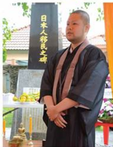
還俗後、ケンコイ移民之碑 法要にて※

が多々あつた。多くの経験をしたが、その中で『今後この経験をどのようにして活かしていくか』という新しい課題が見つかった。私は帰国してからお金を一切持たずに四国八十八ヶ所(通称・お遍路)に行くことにした。実際に1番の霊山寺から徒歩で回って、なんとか現在は17番の井戸寺まで歩いた。そこから徳島駅で1時間ほど托鉢を試みたが1円も頂くことができなかった。やはりタイ人の仏教への信仰のあつさや、僧侶の生活のしやすさというのは日本の比ではないなと痛感した。これでもお大師様信仰のある四国という土地で感じたのだから、他の地域だともっと厳しいであろう。タイでは托鉢で苦労したことはなかった。なにかを頂いても、相手に徳を積ませてあげる行為なのだから頭を下げることもなかった。今はなにかを頂くこと