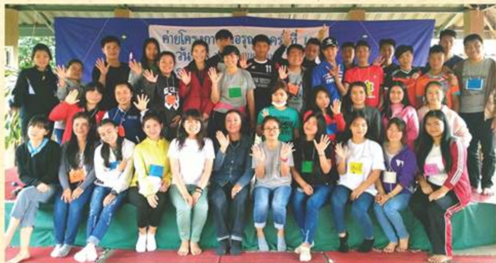
合宿。奨学金で支援している高校生、大学生合計24名、ホイチョンブー村の青年たち8名、暁の家の研修生3名が参加