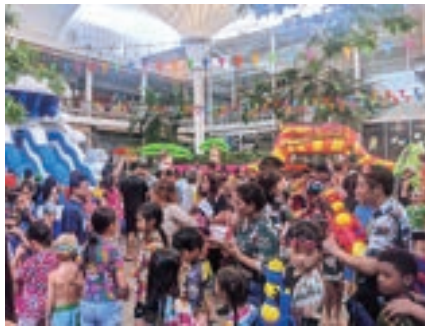
表紙：ソクラーン・水かけ祭り 場所：K-Village (バンコク)

今年のタイの旧正月ソクラーン（4月13日～15日）は、コロナ禍以降4年ぶりに制限がない形で水かけイベントが開催され、カオサンなどの激戦地ほか、ショッピングモールでも盛大に水かけ合戦が行われた。 写真／中村慈恵