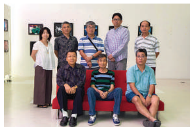
活動日：2カ月に一度