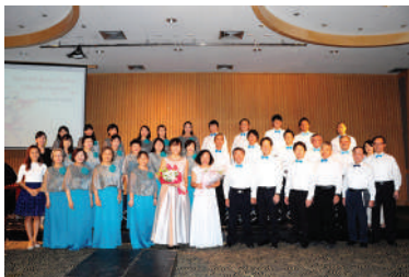
活動日：土曜 ✉ kayochorus@outlook.com