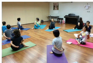
活動日：月曜・水曜・金曜

年齢制限なし！ 何歳でも練習できます。呼吸法と気を循環させることで人間が本来持つ治癒力を高め、健康で丈夫な身体をつくります。