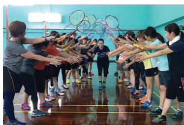
活動日：月曜・木曜