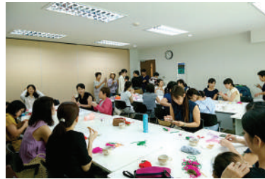
活動日：第2・第4水曜