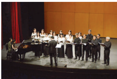
活動日：日曜(月1回~2回) ✉ bangkokkonsej2018@gmail.com