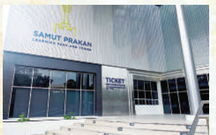
1階のチケット売り場