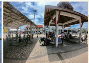
地元民の憩いのスポット。風を感じながらのんびりと釣り糸を垂らして