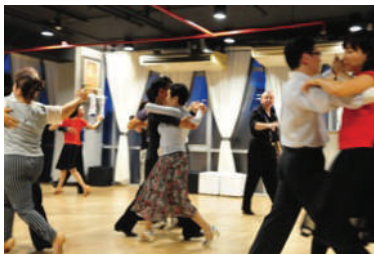
活動日：日曜 ✉ thaijapanese.ballroom@gmail.com