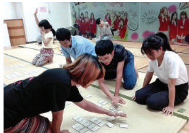
活動日：日曜/対面練習