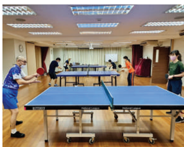
活動日：水曜・日曜