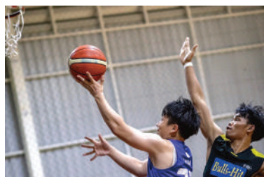
活動日：火曜・日曜