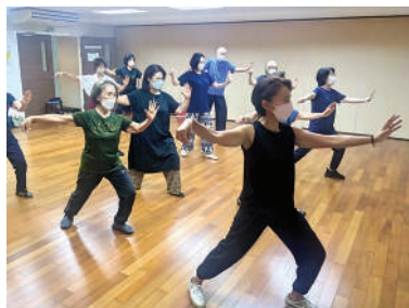
活動日：水曜・土曜