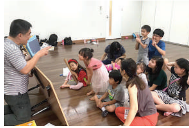
活動日：第2・第4土曜