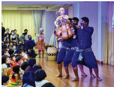
活動日：第1・第3金曜 ✉ newthaishiru@gmail.com