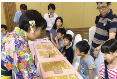
活動日：第1・第3・第5日曜