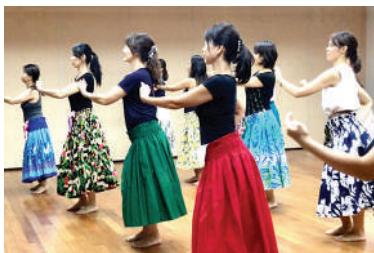
活動日：木曜/子どもクラス・金曜

講師の先生に 基礎から学べるから 初心者でも安心。 お子様連れの方も 大歓迎です。