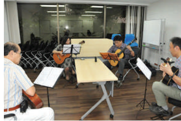
活動日：土曜（月1回程度）