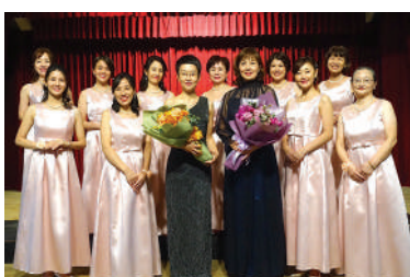
活動日：月曜 ✉ joseichorus.bkk@gmail.com