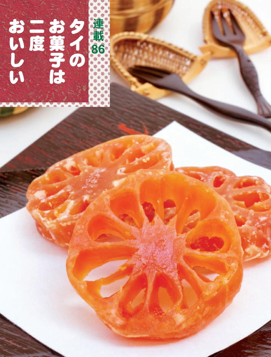
マトウーム・チュアムมะตูมเชื่อมはベルノキの実べールフルーツの甘露煮。砂糖を徐々に足しながら長時間煮るうちに深い橙色に。砂糖を結晶化させていないしっとりタイプもある