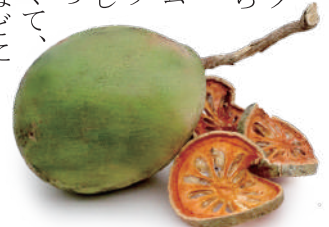
マトウームの果実と乾燥ハーブティー。実がまん丸い種類もある。旬は12～2月だが、市場の店主によると7月まで出回っているとのこと

けることはできませんでした。ラーマヤナは東南アジア全域に広がり、タイでは古典文学ラーマキエンになりました。さて、件の胸の一節はタイ版のラーマキエンにあるのでしょうか。持ち重りのするマトウームと姫君の胸との関わりをしばし考察したのでした。